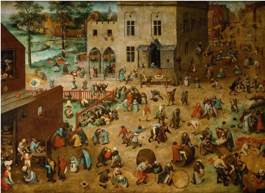
(Les jeux d'enfants, Pieter Bruegel l'Ancien, 1560)

Dans (14a), il est question d'un groupe d'enfants ayant joué dans la cour toute la journée, alors que (14b) parle d'une cour occupée pendant toute la journée par les jeux d'enfants.