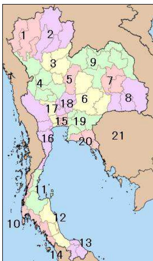
CARTE I : LES “MONTHON”