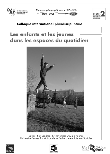
Affiche Colloque « Les enfants et les jeunes dans les espaces du quotidien » - 2006

Parmi ces différents projets, le colloque intitulé « Les enfants et les jeunes dans les espaces du quotidien » a été celui dans lequel j'ai eu le plus de responsabilités, notamment en tant que président du Comité Scientifique. Il a été organisé afin d'engager une réflexion portant sur les espaces de vie, les pratiques, usages et mobilités des enfants et des jeunes, dans une démarche globale, transversale et pluridisciplinaire, avec la confrontation privilégiée des regards entre géographie, psychologie et sociologie. Il a ainsi été l'occasion d'un travail d'équipe très riche, mobilisant plus chercheurs et enseignants-chercheurs d'ESO-Rennes. Ce projet a permis au laboratoire de faire valoir ses travaux et ses compétences sur l'enfance et