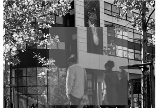
Université Rennes 2

en tant que PRAG coïncidait avec l'ouverture des antennes universitaires de Lorient et de Saint-Brieuc. Ce poste m'a permis d'intégrer l'enseignement supérieur à la fin de mon service civil. Ce recrutement constituait pour moi une réelle opportunité, car il m'a permis de rester en Bretagne, et de participer activement aux activités de mon laboratoire de rattachement dans le cadre du doctorat.