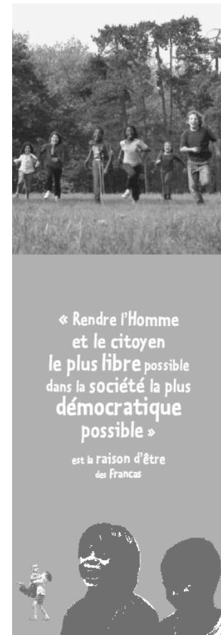
Les Francas http://www.francas.asso.fr

Cet engagement militant s'est aussi traduit par la prise de responsabilités associatives assez variées, aux différents niveaux de l'organisation des Francas, qui m'ont donné une vision assez large du secteur de la jeunesse et de l'éducation populaire mais aussi de l'éducation informelle. Après plusieurs mandats électifs au sein de l'Association départementale des Francas d'Ille-et-Vilaine, j'ai assumé les fonctions de Président pendant plusieurs années. J'ai ensuite occupé les fonctions de Président de l'Union Régionale des Francas de Bretagne, avant d'être élu, depuis 2006, Président de la Fédération Nationale des Francas. Cette formation politique a été particulièrement enrichissante, renforçant mes capacités à construire des projets, à mettre en œuvre les programmes d'actions qui en découlent, mais aussi à pratiquer l'évaluation. Ce sont des compétences sociales très utiles, que j'ai évidemment réinvesties dans le milieu universitaire.