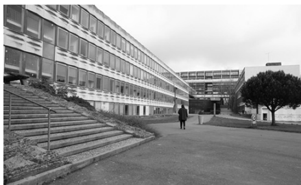
Campus Villejean – Université Rennes 2

Mes trois premières années à l'Université m'ont permis d'obtenir successivement le DEUG (1987), la licence (1988) et la maîtrise (1989). De fait, ma formation de géographe est assez classique, avec des enseignements globalement partagés entre géographie physique, géographie humaine et géographie régionale, ce qui est particulièrement adapté pour se présenter aux concours de l'enseignement secondaire (CAPES et Agrégation).