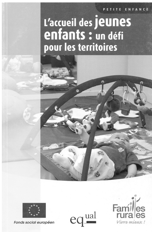
Couverture publication « Familles Rurales » - 2005

Le premier programme de recherche important a été contracté avec un partenaire associatif : la Fédération nationale Familles Rurales. Il s’inscrivait dans un dispositif Equal financé par la commission européenne et piloté directement par Familles Rurales. Il mobilisait plusieurs partenaires internes au réseau associatif (associations départementales