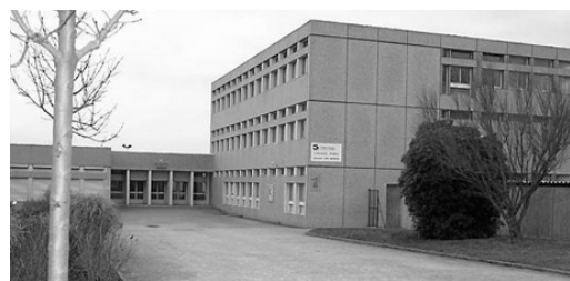
Collège Gérard de Nerval – Vitré (Ille-et-Vilaine)

Mon expérience de l'enseignement secondaire est assez brève puisqu'elle s'étend sur 14 mois. De fait, le nombre d'établissements scolaires fréquentés a été assez limité. J'ai tout d'abord travaillé au collège public Gérard de Nerval, implanté à Vitré (Ille-et-Vilaine), avec deux classes en responsabilité de niveaux 5 ème et 3 ème . Cette première expérience correspond à mon stage pratique de titularisation en complément de la formation professionnelle suivie auprès du Centre pédagogique régional de Bretagne. Simultanément, j'ai participé et enseigné plusieurs séquences pédagogiques au lycée public Bertrand