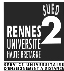
Logo SUED Université Rennes 2

Toutes les activités administratives réalisées durant ma carrière de Maître de Conférences sont récapitulées dans le tableau suivant. Il convient néanmoins de mettre en évidence la première d'entre-elle dans la mesure où elle a occupé plus de cinq ans de ma carrière universitaire. Suite à la mise en place d'un dispositif de tutorat pour les étudiants de première année en géographie, j'ai été directement sollicité par le Vice-Président chargé des formations pour diriger le Service universitaire d'enseignement à distance (SUED) de l'Université Rennes 2. Le projet visait à moderniser le service notamment par la mise en place des technologies d'information et de communication dans la production et la diffusion des enseignements. Cette mission a donné lieu à une décharge complète de service pendant cinq années. L'ampleur du projet a mobilisé une bonne partie de mon temps de travail, ce qui a limité d'autant ma production scientifique. Le tableau récapitulatif suivant présente sommairement chacune des activités administratives exercées.