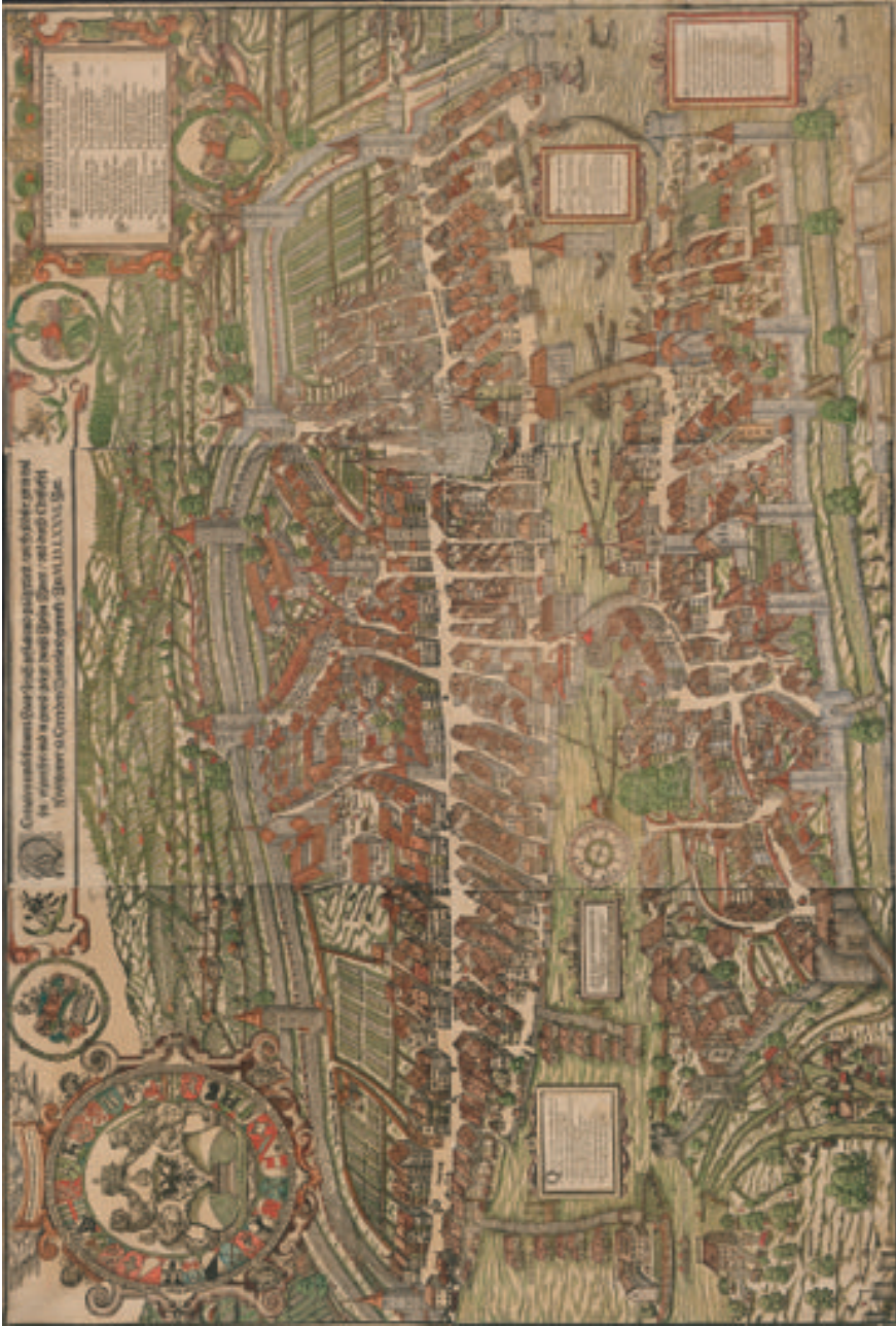
Fig. 2 : La ville de Zurich, gravure sur bois de Jos Murer, 1576, réimpr. de 1766. Zentralbibliothek Zürich, Inv. 374.