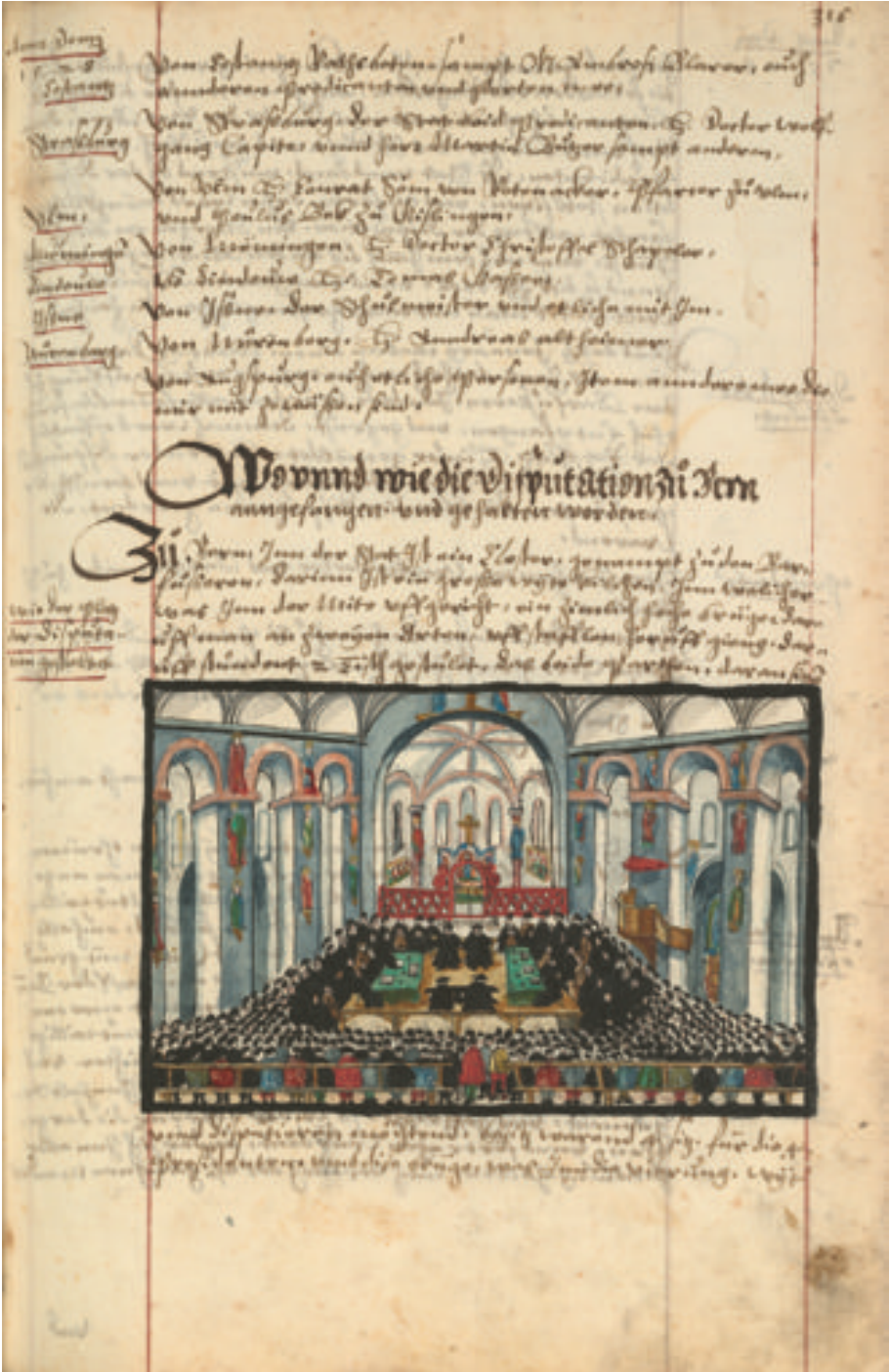
Fig. 6: La dispute de Berne dans la Reformationschronik de Heinrich Bullinger, manuscrit Thomann, 1605. Zentralbibliothek Zürich, Ms. B 316.