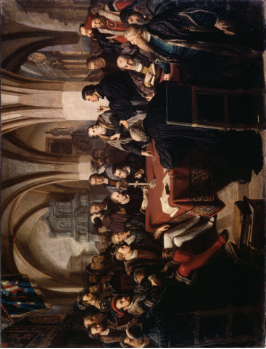
Fig. 11 : Das Marburger Religionsgespräch 1529 zwischen Luther und Zwingli, par August Noack, 1867, huile sur toile, 140 × 187 cm, Hessisches Landesmuseum Darmstadt, GK 470.