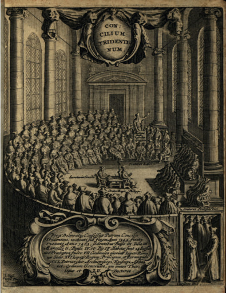
Fig. 1: Frontispice de l' Histoire du Concile de Trente de Paolo Sarpi: Petri Suavis Polani Historiae concilii Tridentini libri octo , Gorinchem: P. Vink, 1658. Bayerische Staatsbibliothek München.