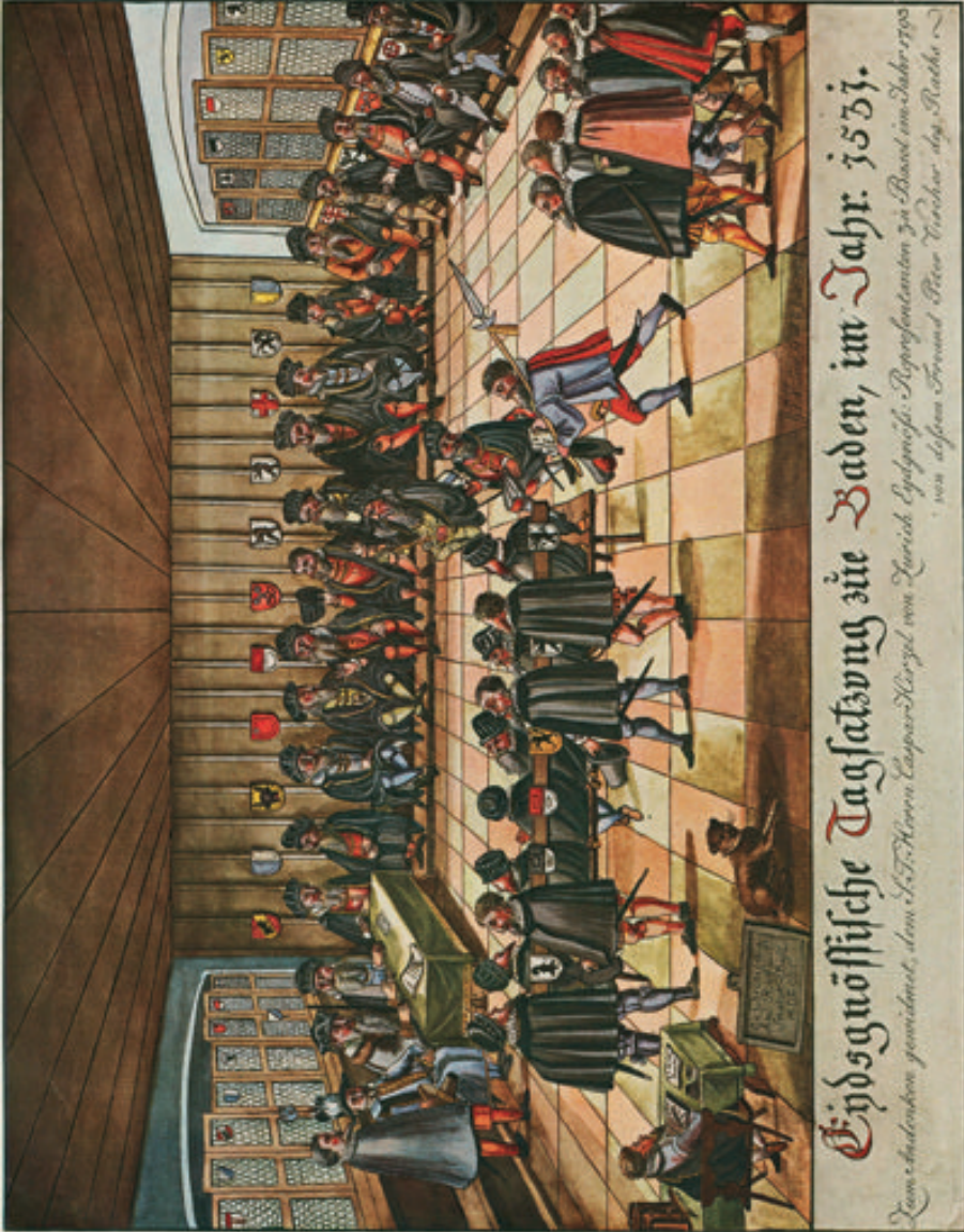
Fig. 8 : Peter Vischer d'après Andreas Ryff, Eidgenössische Tagsatzung zu Baden im Jahr 1537 , 1793. Stadtarchiv Schaffhausen, J 03.06.07/01.