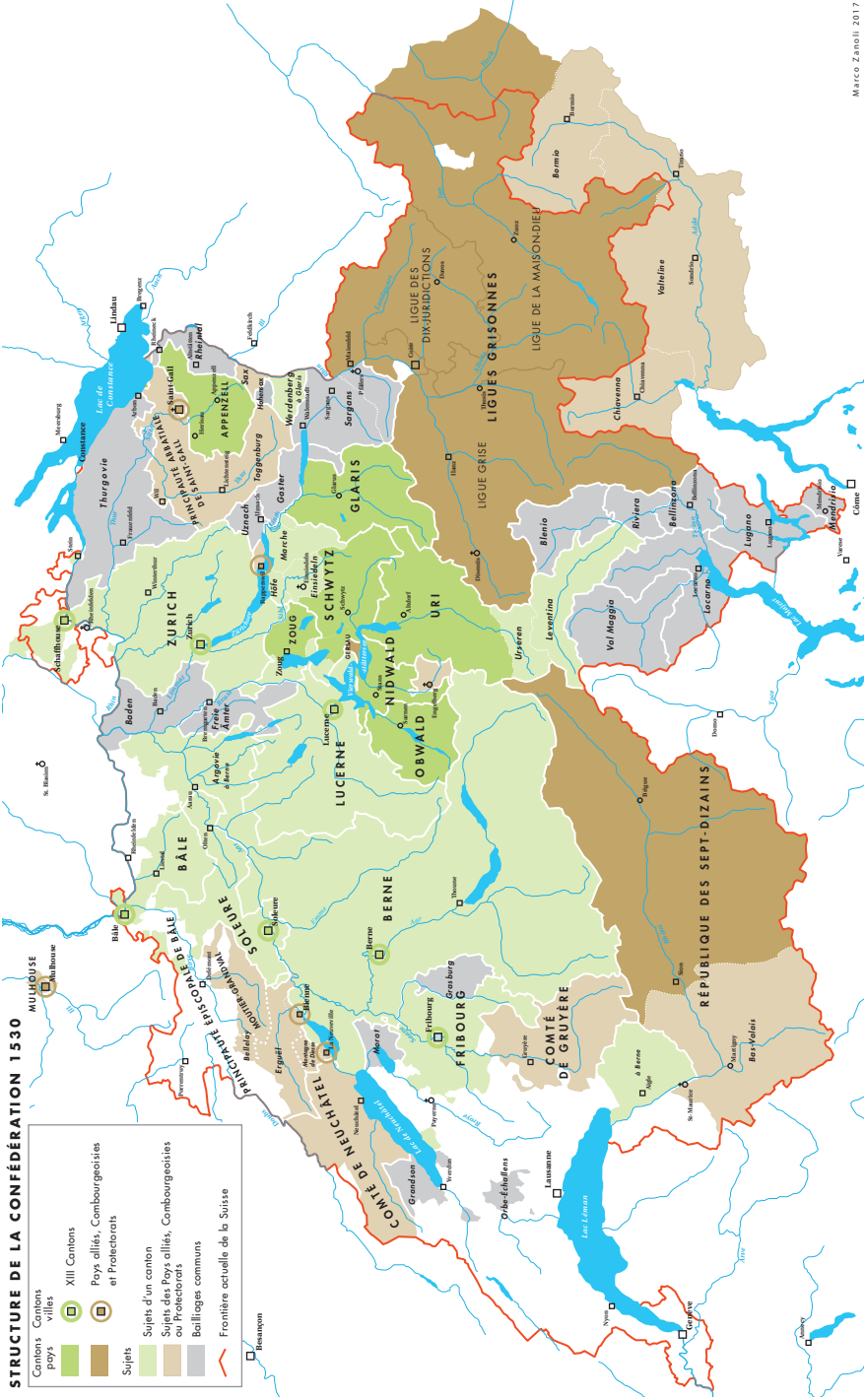
Carte: L'Ancienne Confédération helvétique en 1530, par Marco Zanoli, 2017.