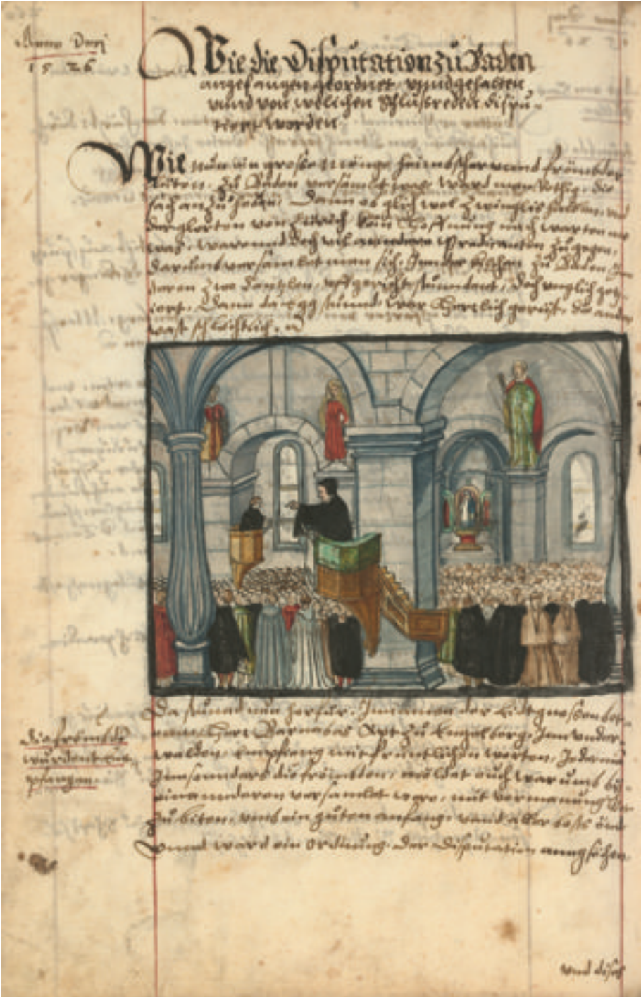
Fig. 7: La dispute de Baden dans la Reformationschronik de Heinrich Bullinger, manuscrit Thomann, 1605. Zentralbibliothek Zürich, Ms. B 316.