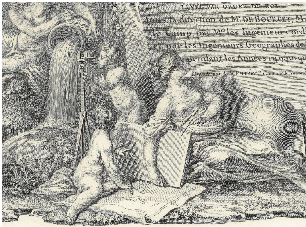
F1758/c. Instruments de relevé