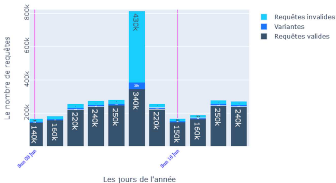
Requêtes en 2019 dans le Dictionnaire Electronique des Synonymes (DES) - C

Pour 2020, l'amplitude maximale de 47 % correspond au lundi 21 septembre.