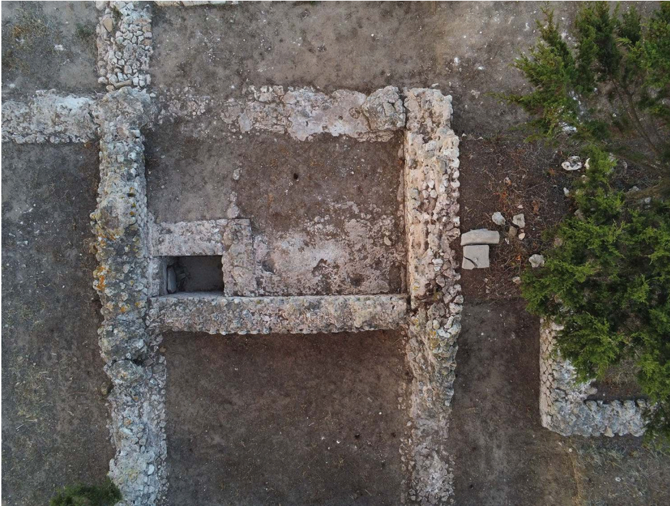
Fig. 3 – Vue zénithale de la fouille de la pièce G7 et des latrines