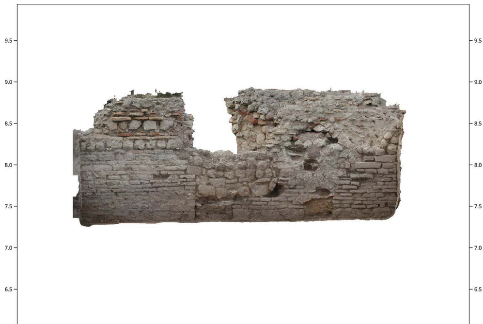
Fig. 2 – Vue frontale du mur de cloison entre les pièces A8 et A11