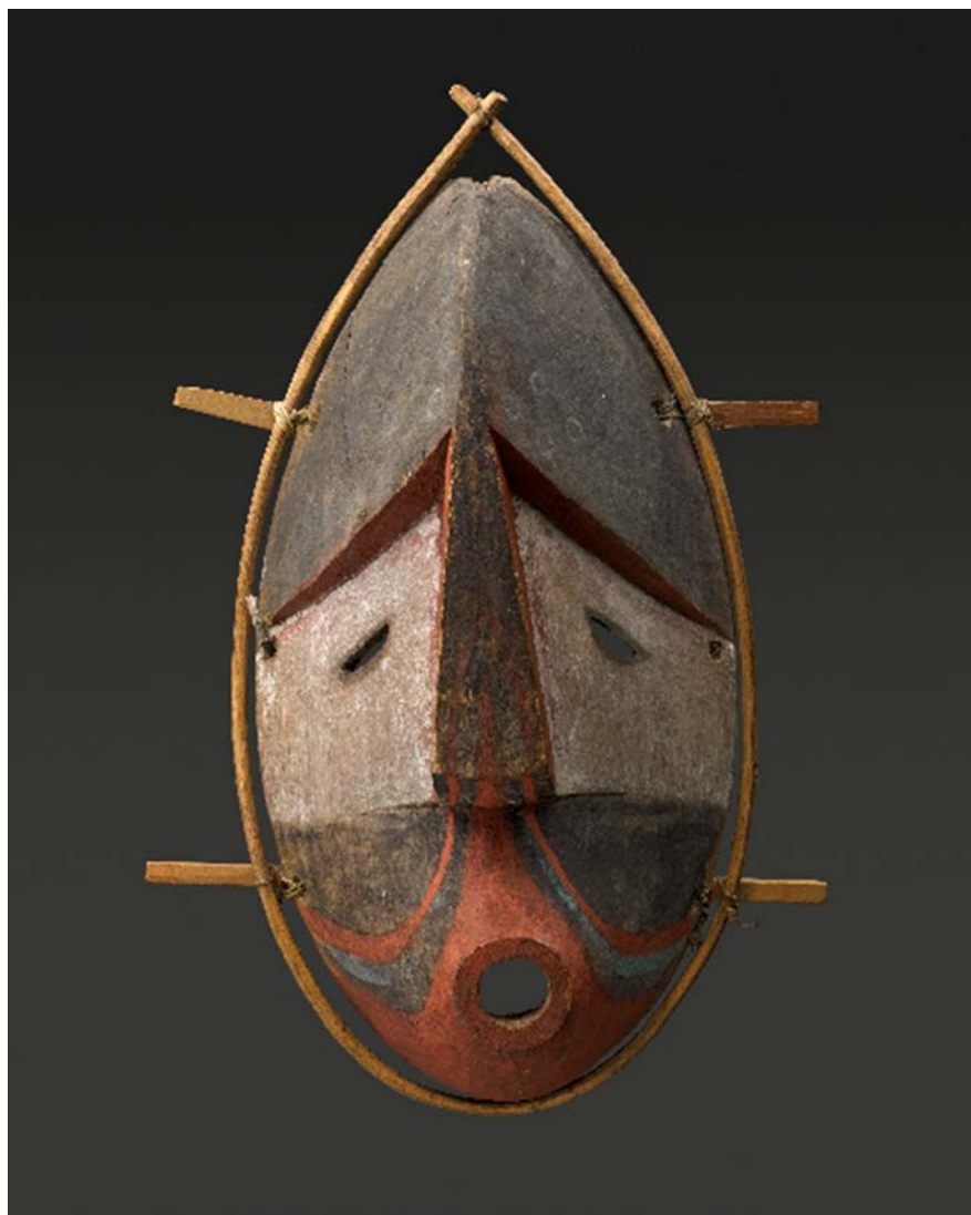
Masque traditionnel chumliq : « Le premier » Bois, tendon, peinture, XIX e siècle

Cet atelier, piloté par Sven Haakanson, a joué un rôle déterminant dans la compréhension mutuelle entre le personnel du musée de Boulogne et ces artistes émus aux larmes devant les objets-témoins de leur culture perdue. Il a constitué le facteur