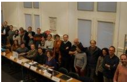
Création du Réseau REPERES – nov 2018, Lyon