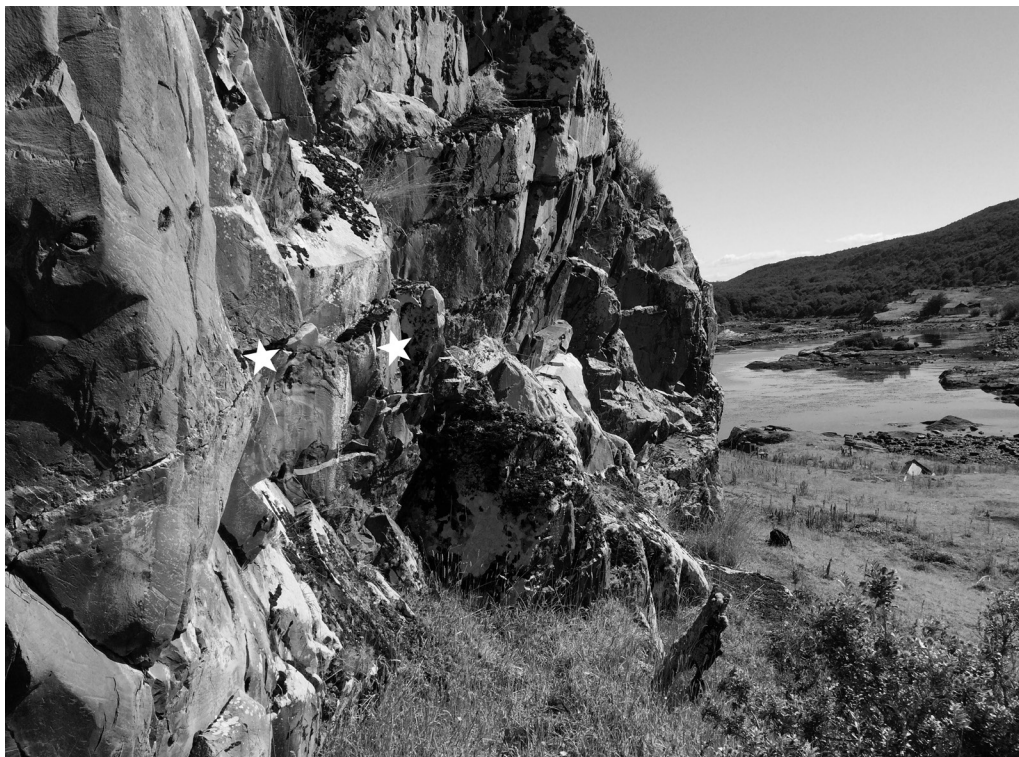
Fig. 2. Ubicación de las representaciones en el sector este del sitio.

El segundo motivo está compuesto por una línea paralela roja, de la que se desprenden cinco líneas verticales paralelas, de 18 cm de ancho y 28 cm de largo, a 1,42 m del suelo actual del sitio (Fig. 4). En el mismo se advierte la posible presencia