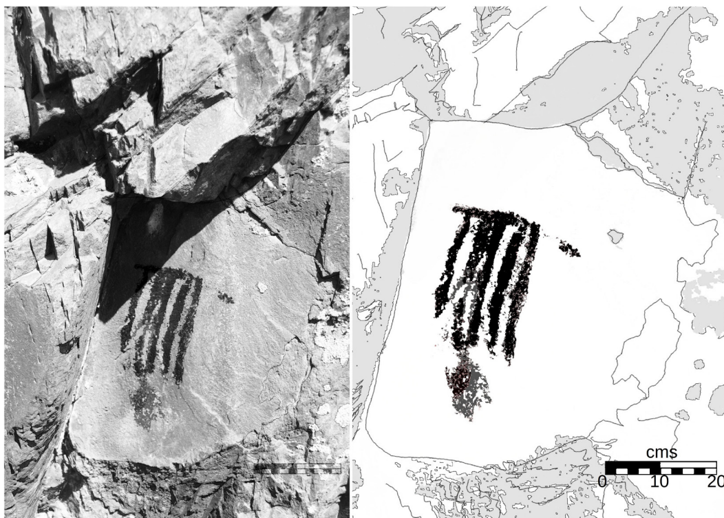
Fig. 4. Motivo 2 geométrico.

a estilos propuestos previamente (Gradín et al. 1976; Gradín, 1978).