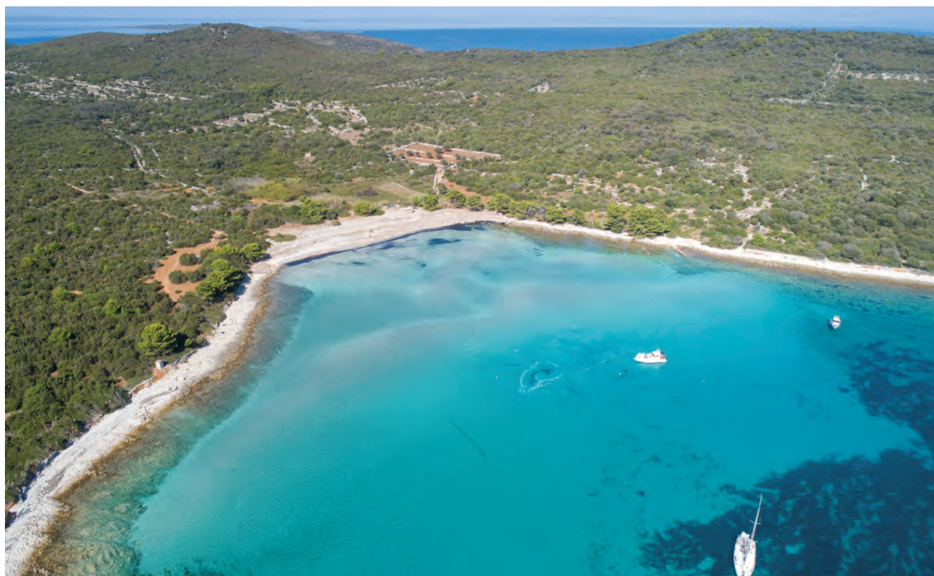
Uvala Paržine, otok Ilovik / La baie de Paržine, île de Ilovik

L'épave a fait l'objet de deux sondages. Le premier a restitué un fragment du complexe d'étrave long d'une dizaine de mètres et assemblé à quelques virures du bordé par des tenons chevillés. Plusieurs éléments de la coque mélangés à une multitude de troncs et branches, des pièces de gréement, des amphores appartenant au chargement et des éléments du mobilier de bord, ont aussi été retrouvés.