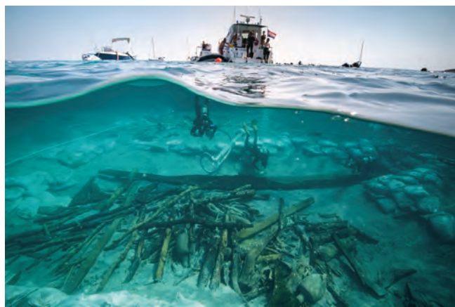
Pogled na prednji dio olupine s teretom drva / Vue de la zone avant de l'épave avec le chargement de bois

Malgré le peu d'informations recueillies sur l'architecture du navire, celui-ci devait présenter une forme inédite caractérisée par une proue à étrave droite ou renversée.