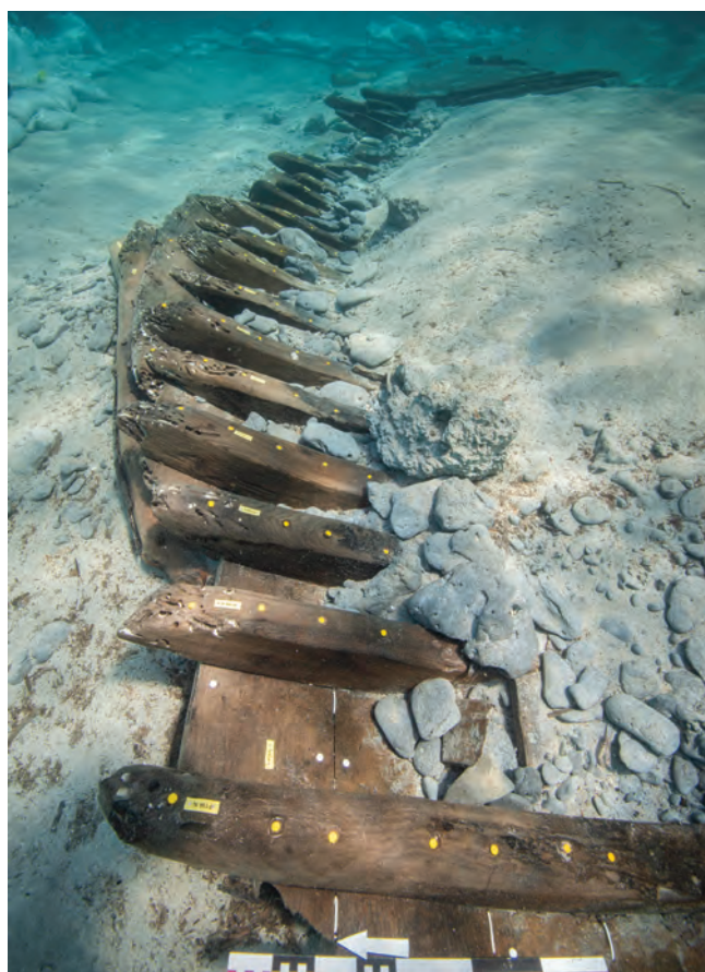
Topografija krmenog dijela broda / Topographie dans la zone arrière du navire