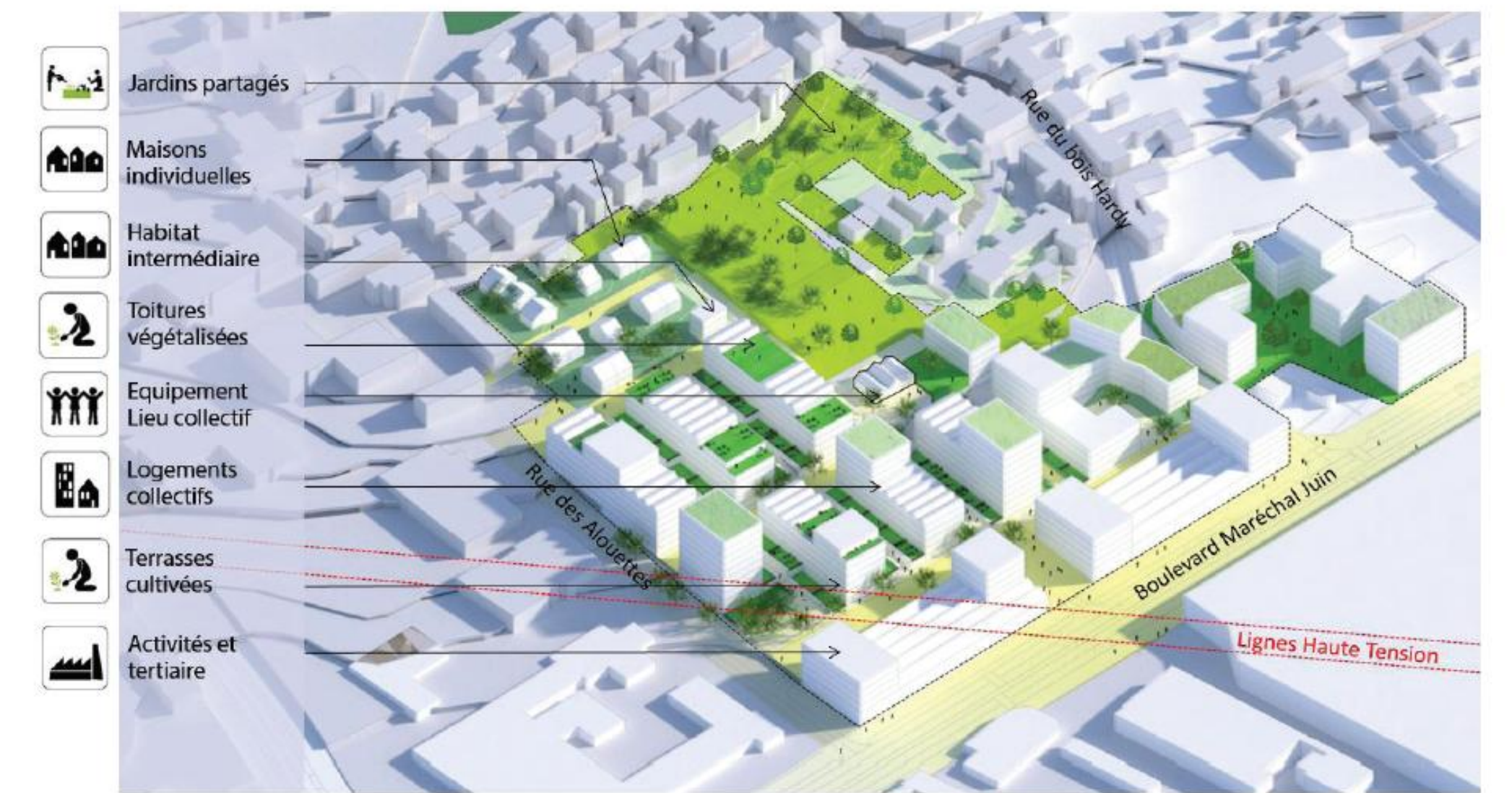
Maquette du plan d'aménagement du Bois Hardy, © Reichen et Robert

L'étude porte actuellement sur l'un des sites en projet de la « nouvelle centralité métropolitaine » nantaise, le quartier Chantenay – Bellevue – Sainte Anne et sur une de ses micro-localités, le Bois Hardy. L'aménagement urbain résidentiel projeté sur ce secteur est propice à l'observation des interactions entre un collectif d'habitants mobilisé, Nantes Métropole et sa société d'aménagement ainsi qu'un groupement d'acteurs économiques. Cette enquête nous permet de saisir la matérialité et les projections sur des objets urbains désirés, de mesurer l'effectivité de l'ancrage territorial local et de saisir les discours, experts et profanes, sur la densité et la mixité en ville. Ce suivi des dynamiques à la fois riveraines et techniciennes est complété par l'analyse du contexte métropolitain en mettant en perspective les approches politiques du Dialogue Citoyen alliés à la fabrique de l'urbain. De cette manière, nous escomptons rendre compte des usages de la proximité à la fois dans l'appareillage politique métropolitain tout en l'incarnant par une étude localisée.