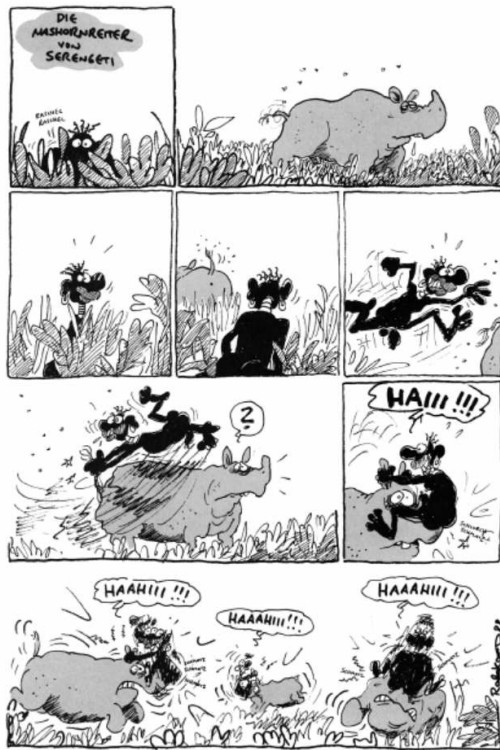
Bild 2: Einseitiger Comic Ralf Königs, der „Die Nashornreiter von Serengeti“ heißt. Im Comic steigt ein nackter, schwarzer Mann absichtlich auf ein Nashorn, um sich mithilfe des Horns zu masturbieren.

„Die Nashornreiter von Serengeti“, Ralf König, Zitronenröllchen und andere Schwulcomix , S.10, Carlsen