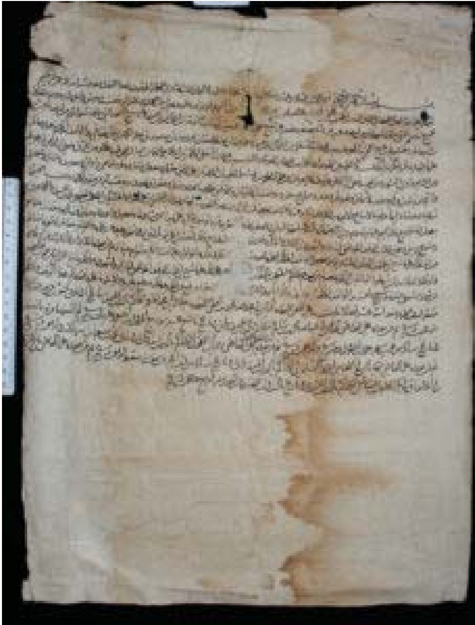
Haram document number 333 recto .