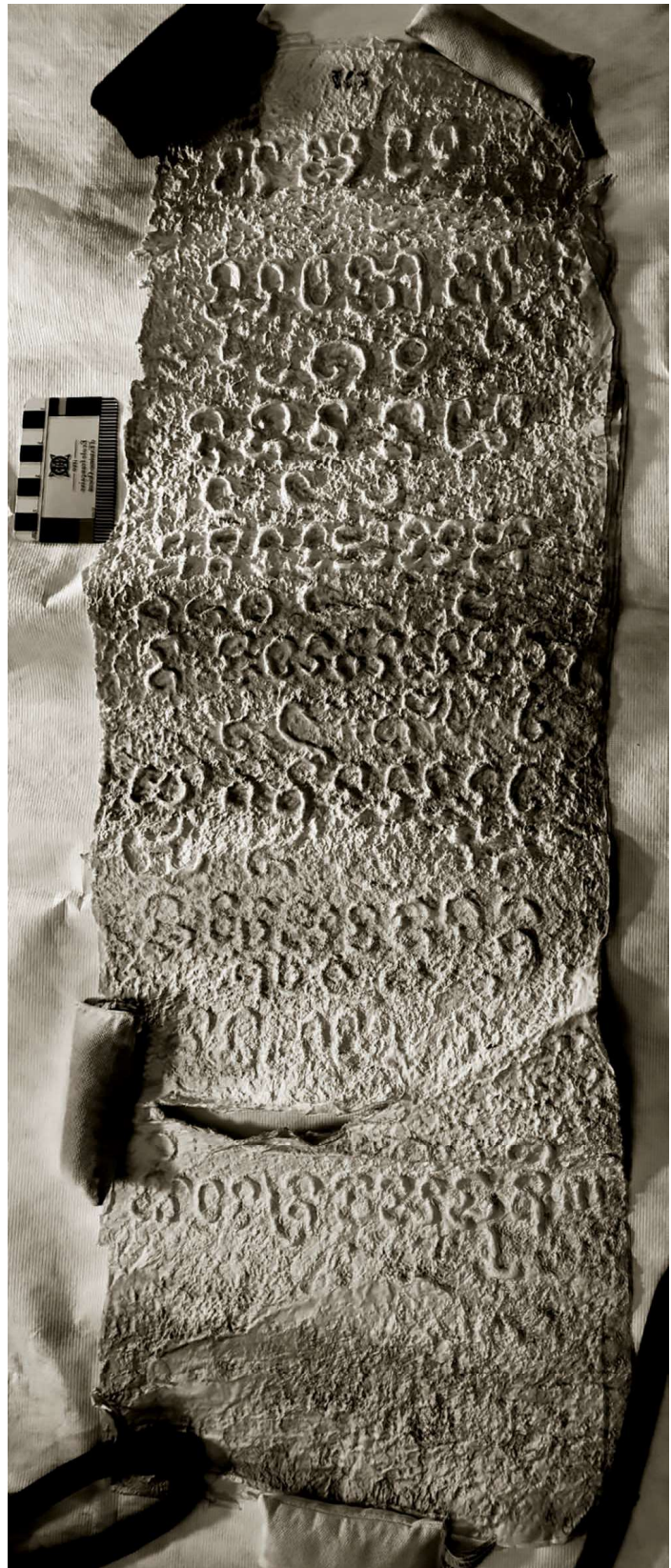
Fig. 5 — Inscription C. 56, face C. Estampage BnF, Inscriptions du Champa et du Cambodge , 413 (54).