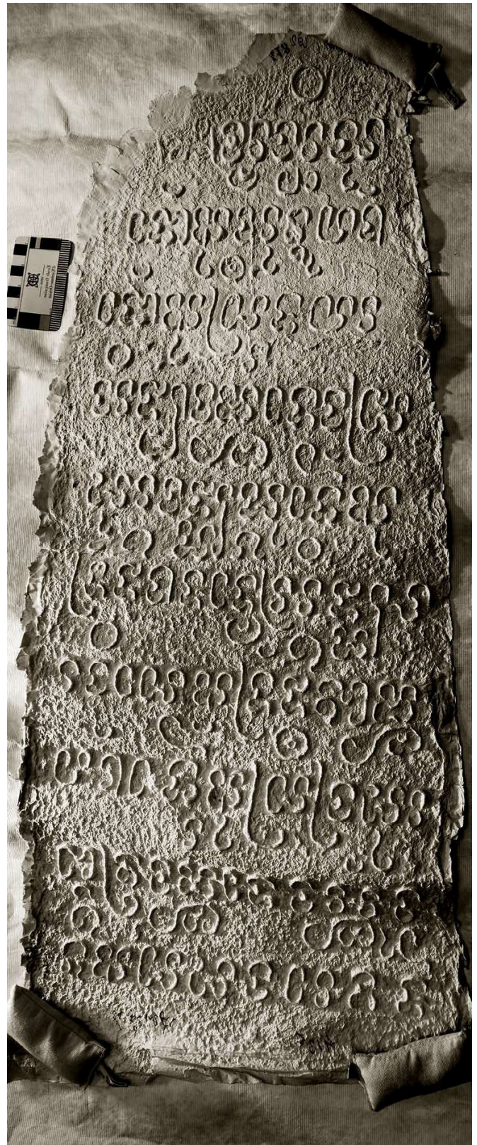
Fig. 3 — Inscription C. 56, face A. Estampage BnF, Incriptions du Champa et du Cambodge, 413 (54).