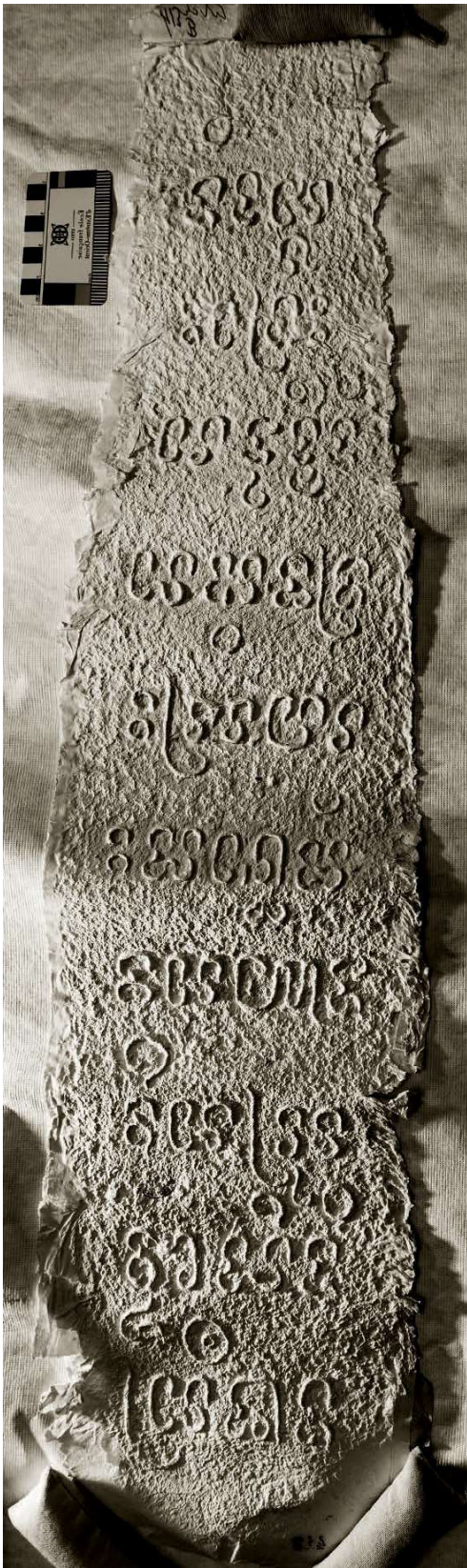
Fig. 4 — Inscription C. 56, face B. Estampage BnF, Inscriptions du Champa et du Cambodge , 413 (54).