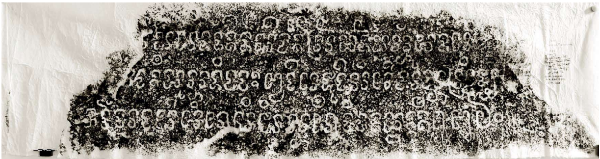
Fig. 2 — Inscription C. 237, face B. Estampage EFEO n. 2405.