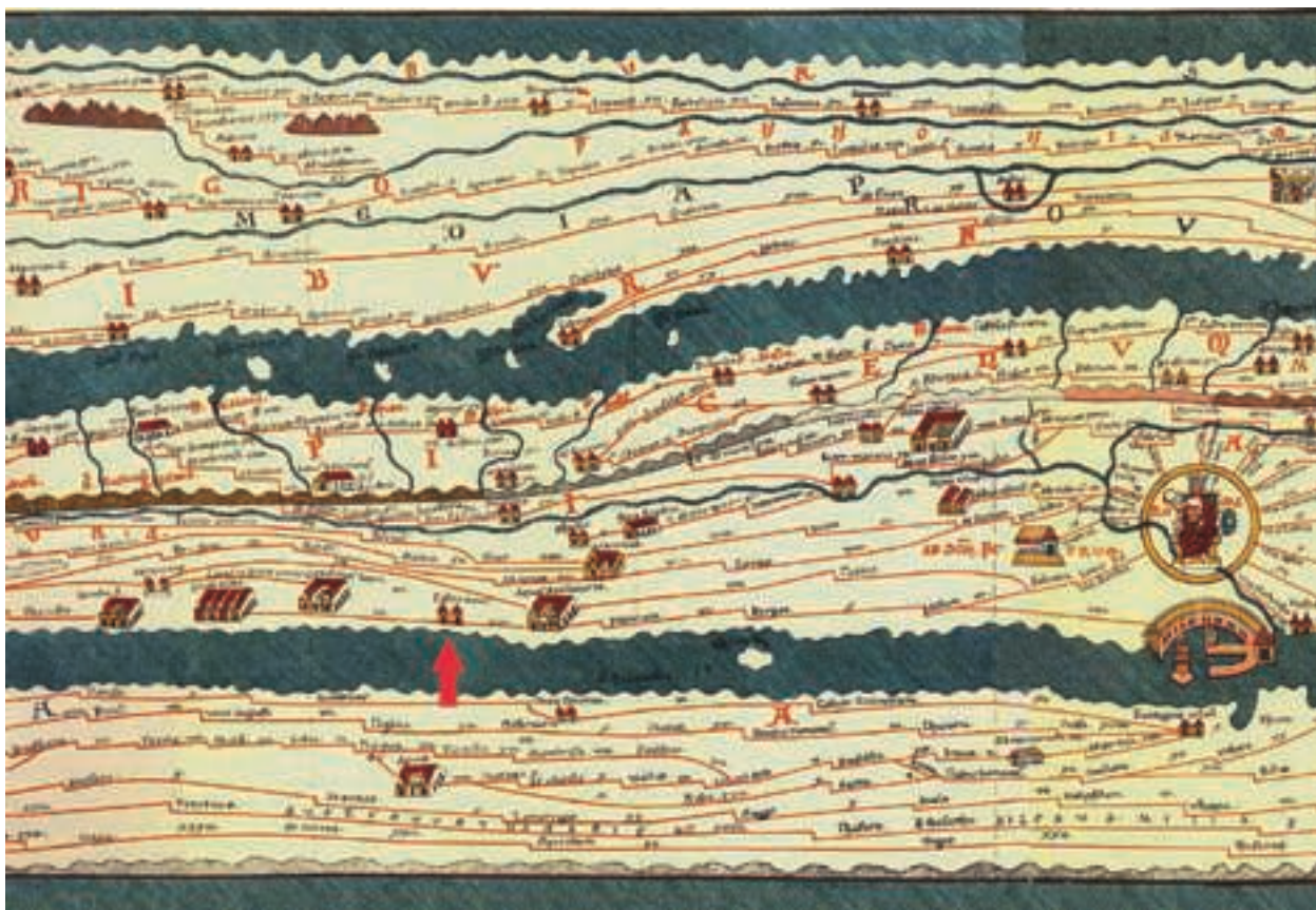
Fig. 1 – Tabula Peutingeriana (segmentum 5).

https://www.hs-augsburg.de/~harsch/Chronologia/Lspost03/Tabula/tab_or04.html