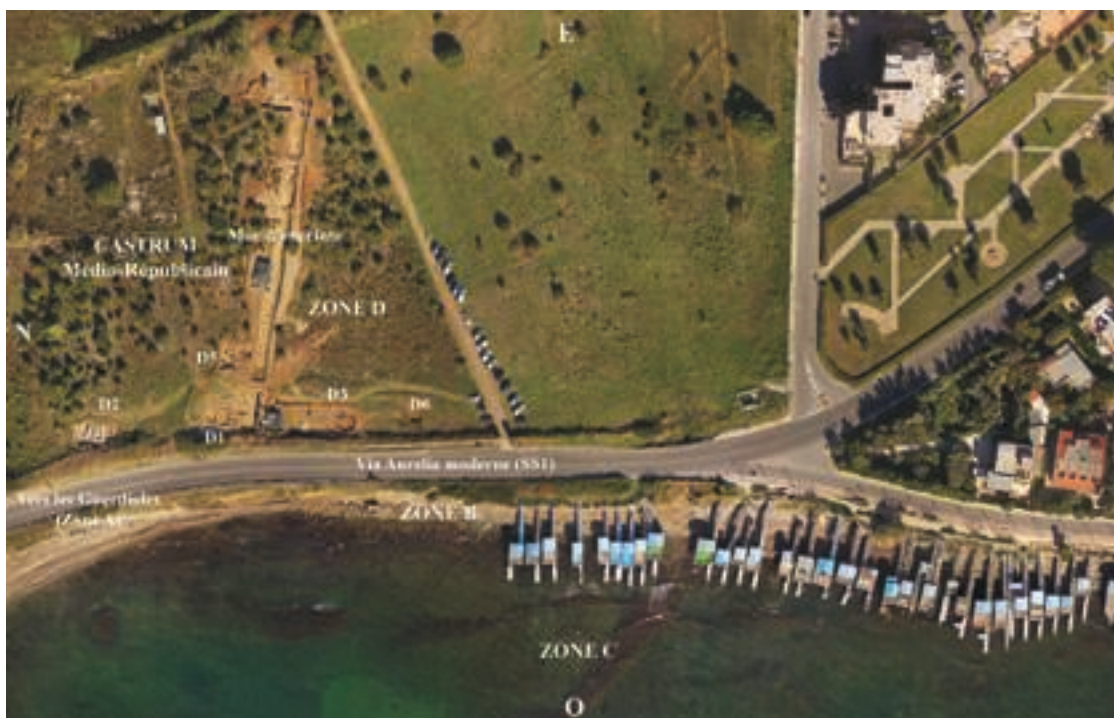
Fig. 3 – Vue zénithale de l'ensemble des zones B et D du site de Castrum Novum . G. Poccardi.