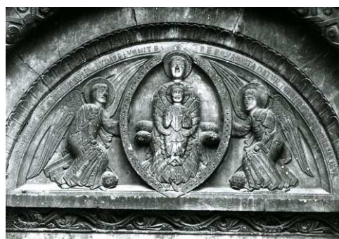
Fig. 3 : Corneilla-de-Conflent (Pyrénées-Orientales), 2 nd e moitié XII e s.

D'autres recueils d'inscriptions concernent d'autres centres importants de pèlerinage. Je ne retiendrai que celui qui intéresse Saint-Martin de Tours, pèlerinage fameux au tombeau du saint, que firent par exemple sainte Radegonde et saint Venance Fortunat au VI e siècle. Ce recueil, dit du Martinellus , comporte dix-sept inscriptions, dont quatre pour l'abbaye de Marmoutier 16 . À l'est de la basilique Saint-Martin on pouvait lire dix vers commençant par l'appel au lecteur « Que celui qui entre dans le temple tourne son visage vers les hauteurs, les accès supérieurs sont ceux qu'emprunte une foi élevée », etc. Or on rencontre à Rome, dans une église Saint-Étienne, qui pourrait être Saint-Étienne-Mineur, fondée par le pape Étienne II au VIII e siècle, ces mêmes dix vers, dans lesquels on a remplacé les deux mentions de Martin ( Martinus , Martinum ), par le nom d'Étienne ( Stephanus , Stephanum ) 17 . Le pape Étienne II est venu en France en 753-754 pour demander l'aide de Pépin le Bref contre les Lombards, et il y est demeuré alors plusieurs mois. Il aura pu, à cette occasion, connaître le Martinellus , ou peut-être vénérer le tombeau de Martin à Tours.