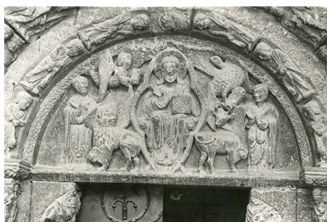
Fig. 12 : Estella (Espagne), San Miguel, Christ du tympan.