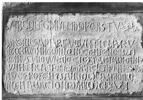
Fig. 2 : Daumazan-sur-Arize (Ariège), église, 1156.