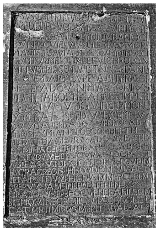
Fig. 1 : Nepi (Italie), cathédrale, IX e s.