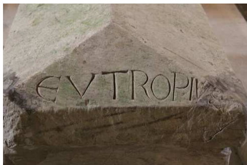
Fig. 11 : Saintes (Charente-Maritime), Saint-Eutrope, crypte, tombeau.