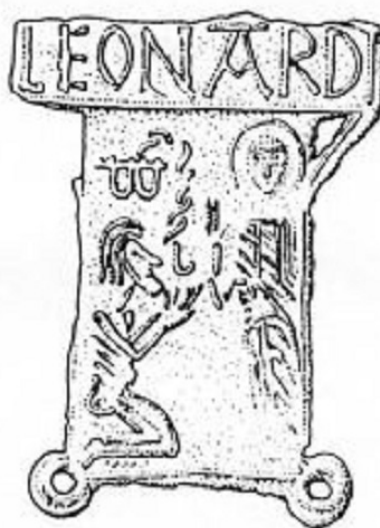
Fig. 5 : Enseigne de pèlerinage de Saint-Léonard-de-Noblat

Autres lieux de pèlerinage : Arles, pour saint Pierre, Chambéry pour le Saint Suaire, Chartres, pour Notre-Dame, Compiègne pour saint Corneille, Larchant, pour saint Mathurin 29 , Le Mans pour saint Julien, Mauriac pour saint Marty 30 , Meaux pour saint Fiacre, Le Mont-Saint-Michel, Noyon pour saint Éloi, Rouen, au Mont-Sainte-Catherine pour Catherine, Saintes, pour saint Eutrope, Saint-Maur-des-Fossés pour Maur, disciple de saint Benoît, etc. Par la documentation écrite on connaît, en outre, un très grand nombre de petits pèlerinages locaux, qui retenaient très régulièrement la piété des fidèles. On « pèlerinait » beaucoup, mais, comme le dit Thomas à Kempis, l'auteur de l'Imitation de Jésus Christ , « ceux qui accumulent les pèlerinages deviennent rarement des saints ».