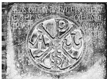
Fig. 7 : Toulouse (Haute-Garonne), musée des Augustins, chrisme provenant des Hospitaliers de Toulouse, XII e s.

En passant par Toulouse, le pèlerin de Saint-Gilles aura pu voir à la porte de l'église des Hospitaliers de Saint-Jean-de-Jérusalem un beau chrisme « pyrénéen », c'est-à-dire les deux lettres grecques, ki et ro, X et P, qui correspondent en latin à CH et R, et sont les deux premières lettres du mot « Christ » ; dans la région pyrénéenne on ajoute régulièrement le S final du mot latin Christus , et on y joint le plus souvent l'alpha et l'omega, première et dernière lettre de l'alphabet grec 40 (fig. 7). Le chrisme est ici accompagné de l'inscription : « Ici on prie Dieu, et cette maison est appelée sa maison. Qu'ici donc vienne celui que tourmente le sentiment de sa faute » 41 . Le chrisme pyrénéen se trouve à plusieurs centaines d'exemples dans le Sud-Ouest de la France - à l'exception du Pays basque et du Roussillon -, ainsi qu'en Aragon et en Navarre. Le pèlerin va donc en rencontrer beaucoup, au tympan des petites églises, où il remplace la représentation du Christ en majesté. En comprenait-il le sens ? Pas toujours sans doute 42 .