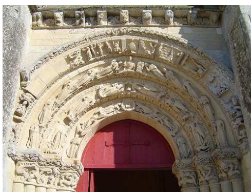
Fig. 10 : Aulnay (Charente-Maritime), Saint-Pierre, tympan, XII e s.

d'Hilaire 53 . En lisant son Guide , le pèlerin apprenait que « le pays poitevin est fertile, excellent et plein de toute les félicités. Les Poitevins sont des gens vigoureux et de bons guerriers, habiles au maniement des arcs, des flèches et des lances à la guerre, courageux sur le front de bataille, très rapides à la course, élégants dans leur façon de se vêtir, beaux de visage, très spirituels, très généreux, larges dans l'hospitalité » 54 . Cet éloge appuyé est un argument en faveur de l'origine poitevine du Guide ... L' Itinéraire de Bruges du XV e siècle, plus développé que le Guide sur l'itinéraire du pèlerin, indique après Poitiers le passage par Croutelle, Lusignan, Melle, Aulnay 55 . À Aulnay, dernière ville poitevine, le pèlerin passait devant le beau portail occidental de l'église où les Vertus – patience, chasteté, humilité, générosité, foi, concorde – écrasaient les Vices – colère, luxure, orgueil, avarice, idolâtrie, discorde. À la droite du Christ, place d'honneur, est placée l'humilité, car « le début de tout péché est l'orgueil », comme le dit l'Écclésiastique 10, 15, et comme le répètent tous les auteurs chrétiens, de Grégoire le Grand à Thomas d'Aquin 56 (fig. 10).