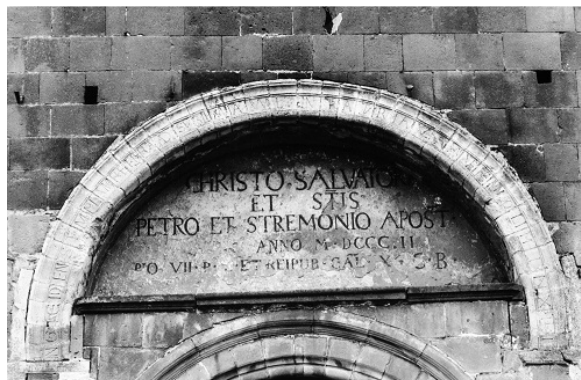
Fig. 4 : Mozac (Puy-de-Dôme), tympan de l'église abbatiale, fin XI e s. Cliché CIFM/CESCM

laissé d'abord le pluriel ( intraturi ), avant de mettre le second pluriel ( venerantes ) au singulier. Dans la sylloge les deux inscriptions devaient être en vis-à-vis sur deux colonnes, et l'auteur de l'inscription de Mozac a lu à la suite le premier vers de chaque colonne. La copie du manuscrit est ici évidente 20 .