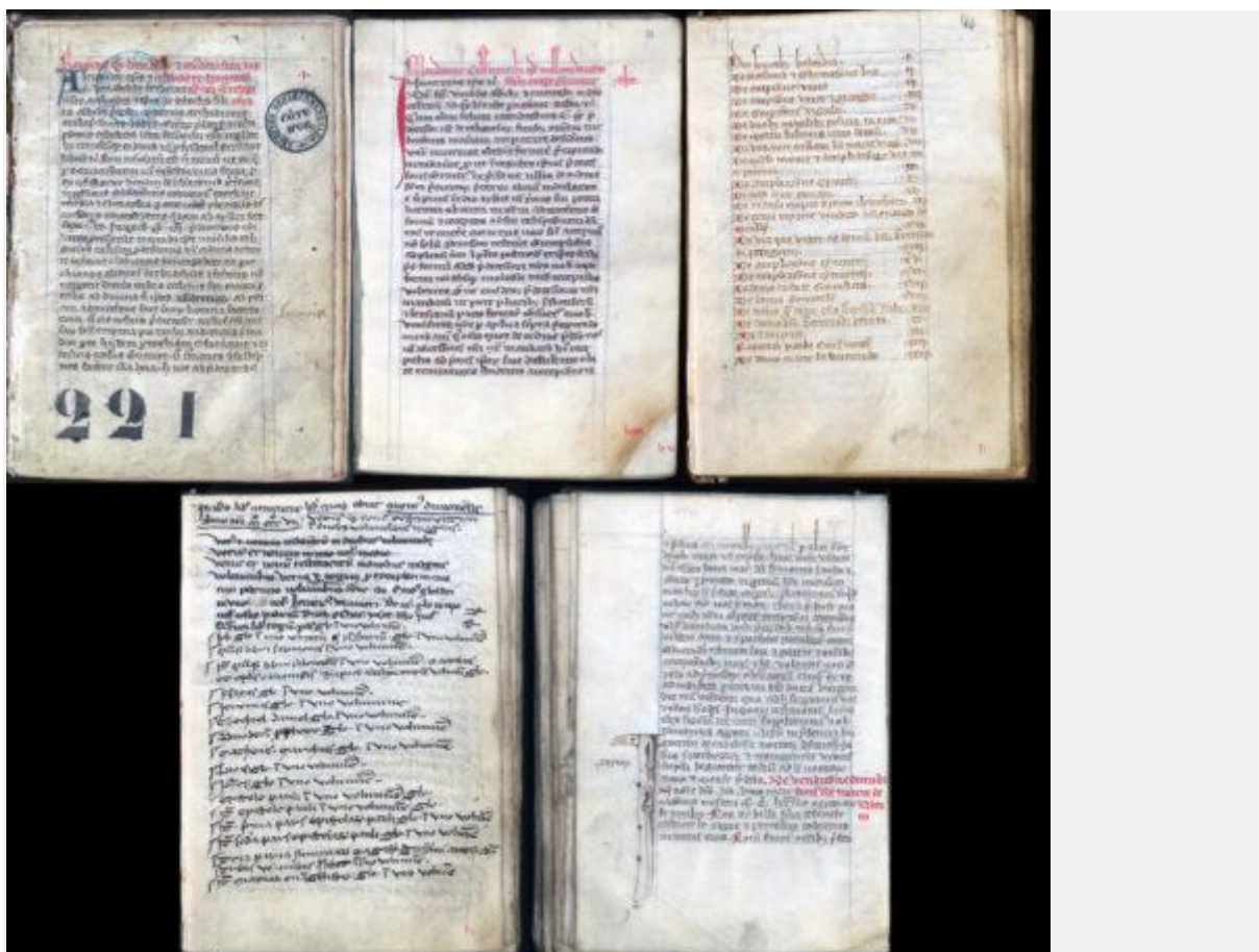
Cartulaire des dominicains de Dijon (c. 1286). Dijon, ADCO 21, f. 1r, 28r, 144r, 145r, 173v.