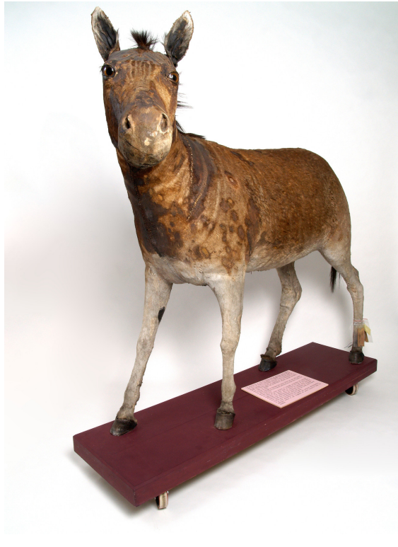
Figure 2 - Equus quagga quagga , inv. 40002121, Musée des Confluences (Lyon, France).

choix scientifiques et finalement, de la collecte comme construction d'un savoir (Bourguet, 2017, p. 24-27).