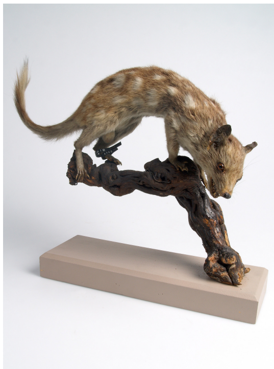
Figure 6 - Dasyurus (Dasyurus) viverrinus , inv. 40000419, Musée des Confluences (Lyon, France).

La qualité scientifique des spécimens classés et exposés est aussi fondamentale pour conquérir la reconnaissance des pairs savants. Cette réalisation repose également sur des gestes techniques que Jourdan apprend alors à maîtriser, entre sa nomination en 1832 et l'ouverture de la Galerie en 1837. Des notes du carnet, qui viennent occasionnellement s'intercaler entre les listes d'acquisition, révèlent ce processus d'apprentissage construit dans le mouvement de va-et-vient entre la main et l'œil, entre le geste d'observation et celui de la prise de notes (Bourguet, 2017, p. 25). Il note par exemple que pour préserver les oiseaux empaillés, il faut « humecter le plumage avec de l'acide arsénique » 58 . Plus bas apparaissent des réflexions sur l'organisation des tablettes des armoires, leur hauteur, leur écartement par rapport à l'encadrement des fenêtres. Plus loin, il reproduit un quadrillage simple pour évoquer le « rapporteur » dont lui a parlé Busconi pour