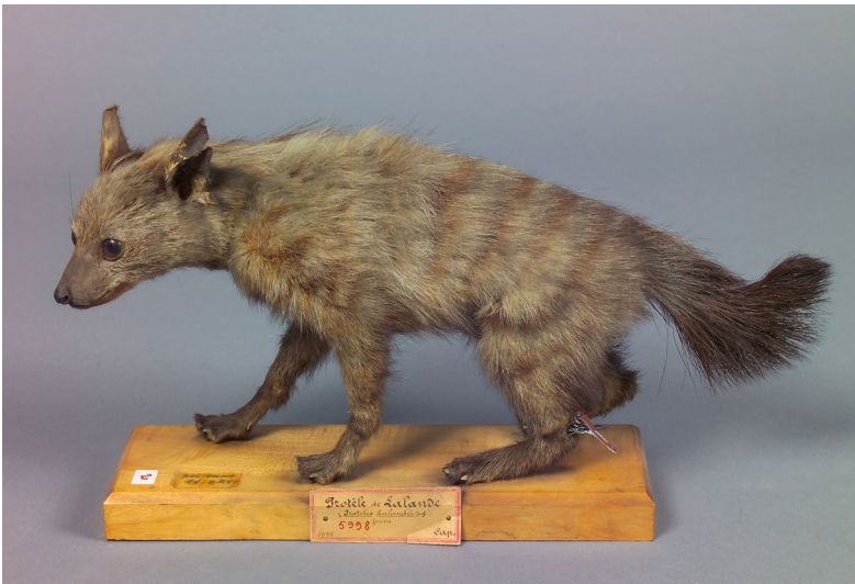
Figure 5 - Proteles cristatus , inv. 40000276, Musée des Confluences (Lyon, France).