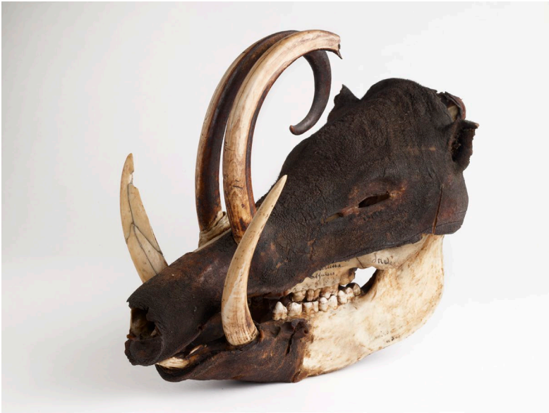
Figure 4 - Babyrousa babyrussa , inv. 50002086, Musée des Confluences (Lyon, France).