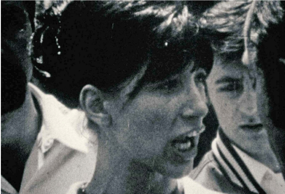
Photogramme extrait de La Reprise du travail aux usines Wonder , un film de Jacques Willemont (1968), copie d'écran. Visionner le film