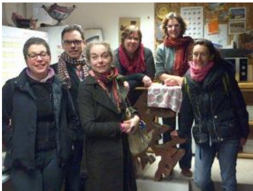
Réunion Commission Recherche, Cresson, 2014

La documentaliste du CERMA y crée une commission de travail en 2011 pour les bibliothèques recherche des écoles ; celle-ci se réunit régulièrement depuis, et partage un espace collaboratif dans l'intranet du MCC jusqu'à la mise en ligne de son carnet de bibliothèque dans hypothèse en 2017. La documentaliste CRESSON en a été co-rapporteur pendant cinq ans, remplacée par celle du CRENAU. La veille en IST réalisée par la documentaliste CRENAU est consultable depuis avril 2017 dans le carnet.