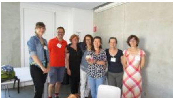
Réunion Commission recherche, Ensa Strasbourg, 2017