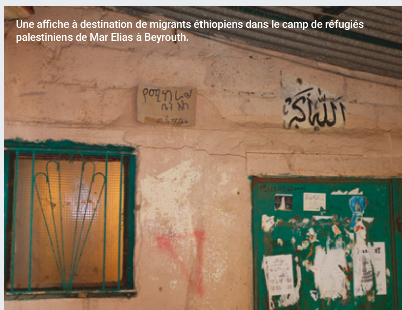
Une affiche à destination de migrants éthiopiens dans le camp de réfugiés palestiniens de Mar Elias à Beyrouth.

La plupart des travailleurs migrants, qu'ils soient originaires du Moyen-Orient, d'Asie du sud ou d'Afrique, occupent des emplois peu qualifiés et pour certains précaires. Pour ceux qui travaillent dans le secteur informel ou comme journalier dans l'agriculture ou la construction, le confinement a été synonyme de perte de leur