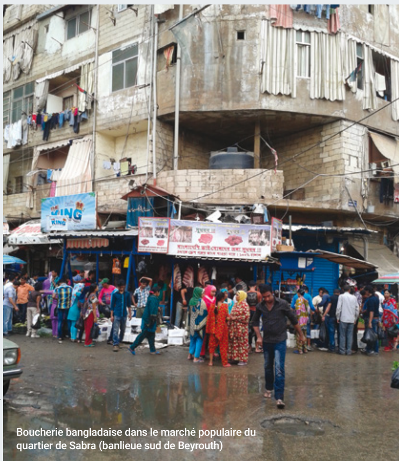
Boucherie bangladaise dans le marché populaire du quartier de Sabra (banlieue sud de Beyrouth)

Les effets combinés des crises sanitaire et économique, s'ils touchent l'ensemble de la société libanaise et particulièrement les classes populaires et moyennes, affectent particulièrement les migrants qui constituent une part importante des populations les plus défavorisées et les plus vulnérables. Un nombre croissant de migrants tentent de quitter le Liban, faute de pouvoir subvenir à leurs besoins. La crise économique qui se prolonge et les conséquences de l'explosion du 4 août 2020 dans le port de Beyrouth, plonge le Liban dans une période d'incertitude, accentuant d'autant les inégalités socio-économiques déjà très prononcées avant la crise.