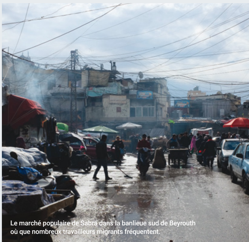
Le marché populaire de Sabra dans la banlieue sud de Beyrouth où que nombreux travailleurs migrants fréquentent.

La Covid-19 a aussi été un révélateur de la précarité des conditions de vie et de logement des travailleurs migrants au Liban et plus particulièrement dans la capitale. Souvent relégués dans des quartiers périphériques, les travailleurs migrants partagent des appartements insalubres pour limiter les coûts de location. Ce type de logement est très répandu dans les marges urbaines, autour des camps de réfugiés dans les banlieues de Beyrouth, dans des quartiers comme Sabra, Borj el Barajneh ou Nabaa. En mai dernier, un foyer d'infection se déclare dans un bâtiment insalubre du quartier résidentiel de Ras al Nabeh, où résidaient près de 200 travailleurs Bangladais dans des conditions sanitaires très précaires. Plusieurs dizaines de migrants seront infectés, et face à la crainte par la population du quartier de diffusion du virus, l'ensemble des migrants seront transférés en quarantaine. Le respect des gestes barrières, comme le lavage régulier des mains, ou de la distanciation sociale étaient impossible dans un bâtiment sans accès régulier à l'eau courante et où résidaient un nombre très important de travailleurs dans des espaces exigus et mal aérés. De nombreuses associations caritatives ont craint une stigmatisation accrue des populations migrantes dans un contexte de fortes tensions sociales. La surpopulation des quartiers dans lesquels vivent les migrants, l'insalubrité et l'exiguïté de nombreux logements, sont également des sources d'inquiétudes en cas