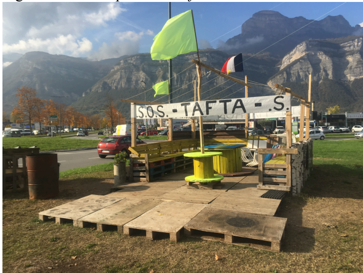
Figure 3. Le rond-point du Rafour au 30 octobre 2019

Les soirs d'assemblée, l'éclairage avec un projecteur alimenté par un groupe électrogène renforce encore cette mise en scène, faisant ressembler le rond-point à un îlot, une oasis dans la nuit. Les gilets jaunes disent bien son intérêt premier : « il est connu dans le secteur ; des milliers de personnes passent à proximité venus de quatre directions » ; « on est visibles et on peut distribuer des tracts aux véhicules qui roulent doucement ». 27 200 véhicules dont plus de 900 camions 6 empruntent quotidiennement le rond-point avec le flots de nuisances liées (bruit, odeurs, pollution...) qui n'en font pas le milieu le plus favorable à une installation dans une vallée au climat contrasté. Pourtant, le site est fréquenté avec des qualités qui expliquent sans doute sa pérennité. Sur quelques mètres carrés au bord de la départementale, se pressent de 20 à 60 personnes selon les jours. En journée, le site est habité, avec ses habitués, ses rythmes et des pics de fréquentation en soirée, les Assemblées générales du mercredi et les actions du samedi. Les gilets jaunes transforment le « lieu » et le « lieu » les transforme, les façonne en retour.