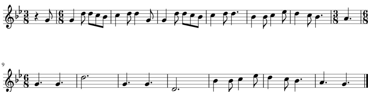
Exemple 2 Le bouvier (Réf. 524, Tab. 3), thème

La pénibilité du labeur du bouvier est représentée par trois accords dissonants, plaqués avec force et à la sonorité massive, sur les injonctions du bouvier à ses bêtes – Ah ! Oh ! Uh ! (ex. 2 : mes. 9 – 11) – qui introduisent la première strophe, puis reviennent sans cesse. [40] Ainsi, le travail du bouvier est inséparable de ses souffrances et de sa pauvreté. Il est aussi la cause du malheur qui va bientôt frapper sa femme, et qu'évoque son mari quand il l'interroge sur sa santé. Soudain un accord, joué morendo (1'28"), le laisse attendre et annonce la parole de son épouse. Si elle n'est pas encore certaine de mourir, la musique la dit pourtant déjà condamnée. Les strophes 5 et 6 (de 2'01" à 3'09"), sont en effet accompagnées par un orgue seul, qui semble déjà jouer, évoquant l'église, pour l'office funèbre de Jeannette. À ce dépouillement musical, évocateur du dépouillement matériel et bientôt de la solitude du bouvier, font contraste les trois derniers accords de la chanson. Joués doucement, par les cordes, sur les injonctions du bouvier, ils sont cette fois majeurs, et éclaircissent finalement cette atmosphère pesante. La mort de Jeannette est en effet la promesse de son repos, dont les pèlerins assureront la bénédiction.