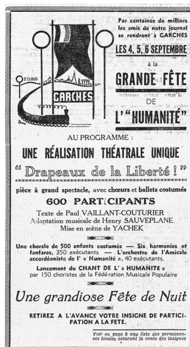
Figure 2. Affiche pour la Fête de l'Humanité (« L'Humanité », 24 août 1937)

À partir de 1936, Sauveplane publie beaucoup dans « L'Humanité ». Ses contributions portent sur la vie musicale et chorégraphique parisienne, les œuvres nouvelles, les compositeurs – tels que Grieg, Strauss, Debussy, Ravel, Roussel, Honegger, Prokofiev –, mais aussi sur des thèmes historiques et sur l'éducation musicale. Le 16 février 1936, dans son article Musique et chants révolutionnaires , écrit en marge de la tenue du concert des Chants de la liberté , Sauveplane différencie musique et chant, considérant ce dernier comme le fruit de l'effort collectif et la voix d'un peuple. [11] Il attribue ainsi aux paroles une valeur historique et politique supérieure à celle de la musique, [12] et se laisse deviner comme un compositeur au service de la sublimation du texte qu'il doit mettre en musique, pour maximiser son effet politique. Peut-être met-il en pratique cette éthique dans deux de ses travaux de 1937: [13] les musiques du Chant de l'Humanité et de la pièce de théâtre Drapeaux de la Liberté ! , paroles et textes écrits par Paul Vaillant-Couturier, tous deux joués pour la fête de « l'Humanité ». Le Chant de l'Humanité est créé le 5 septembre 1937 par 150 choristes de la FMP. Drapeaux de la Liberté ! rassemble les 4, 5 et 6 septembre une chorale de 500 enfants, 350 musiciens d'harmonie et un orchestre d'accordéons (voir Fig. 2). Tout ici laisse en effet à penser la réalisation d'une conception politique de la musique mise au service du peuple.