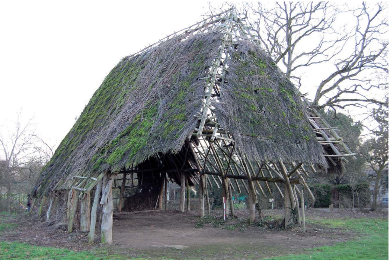
Document 3. Loge à poteaux plantés à Vihiers (49), " La Dauphinerie ", 2008.