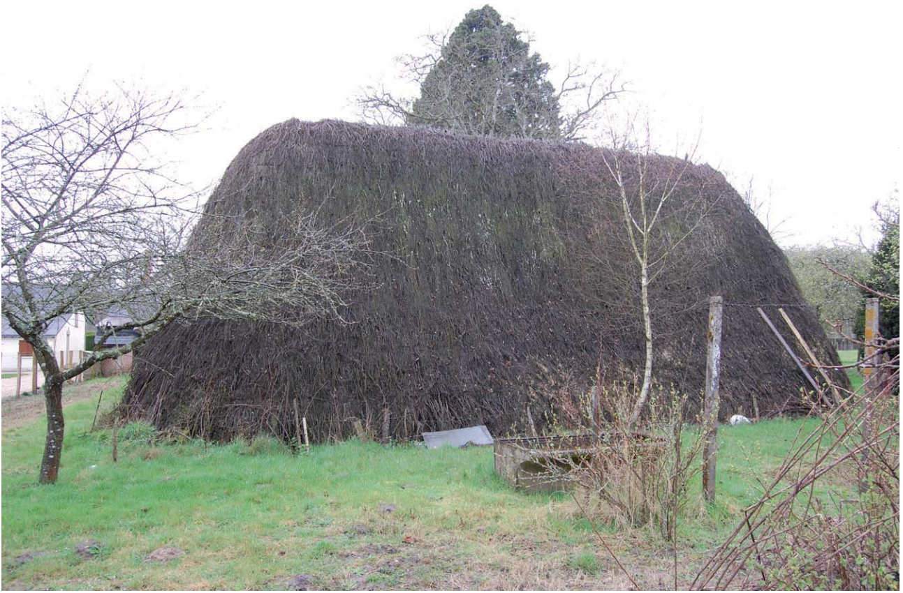
Document 2. Loge à chevrons plantés à Ambillou (37), " La Chaussée ".