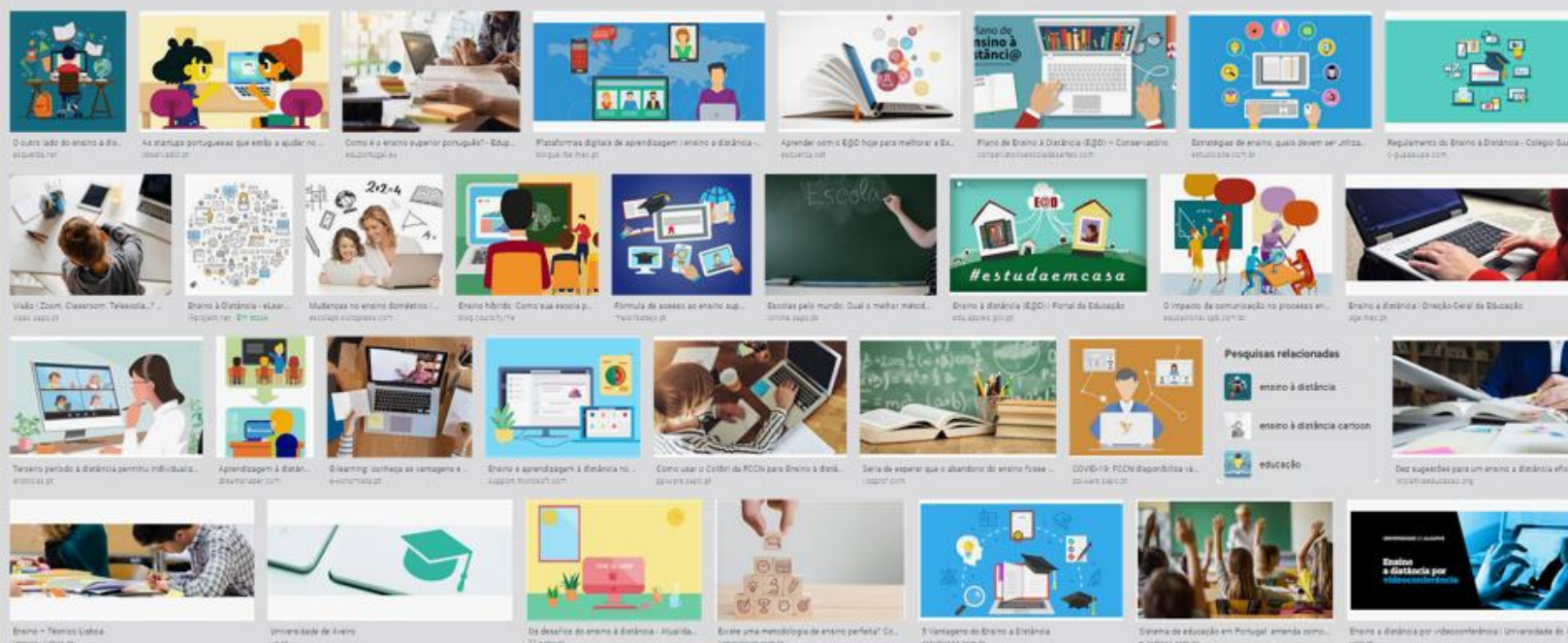
Figura 4 – Os 33 primeiros resultados da busca “ensino” – google.pt (2.nov.2020)