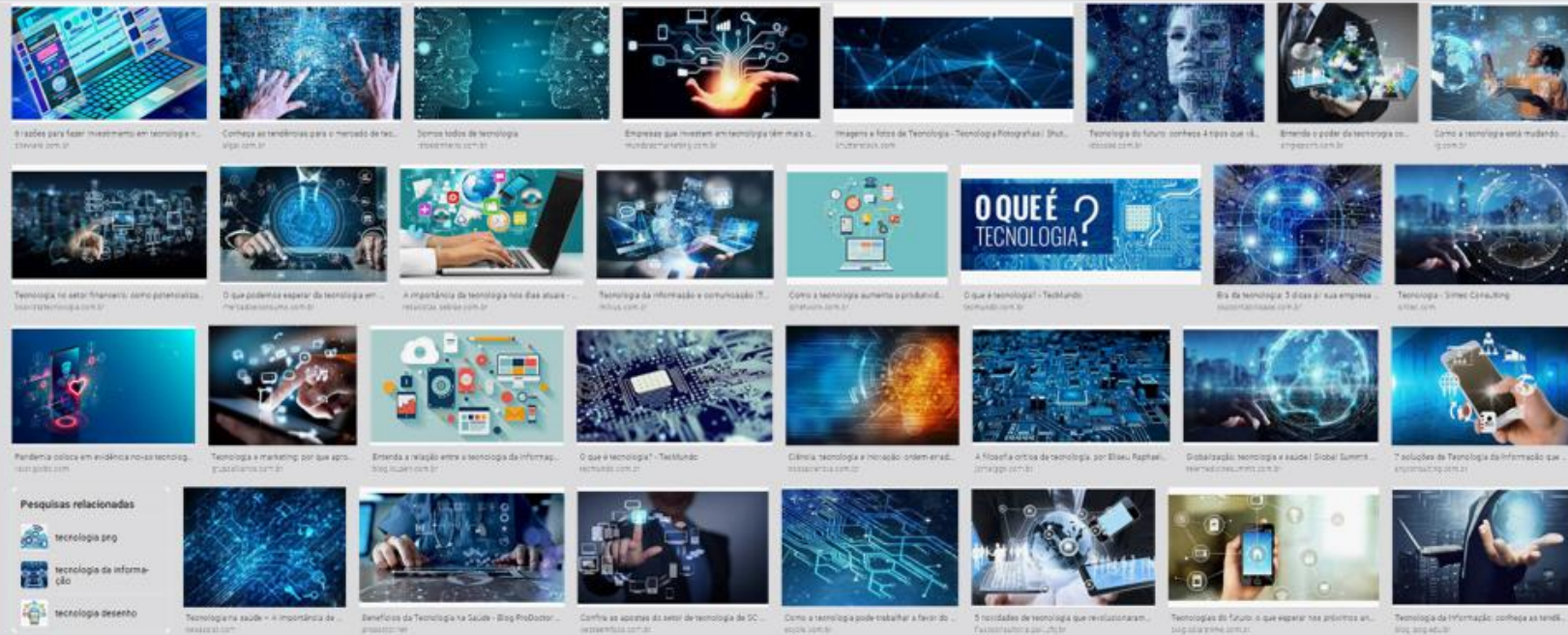
Figura 2 – Os 32 primeiros resultados da busca “tecnologia”, google.com.br (2.nov.2020)