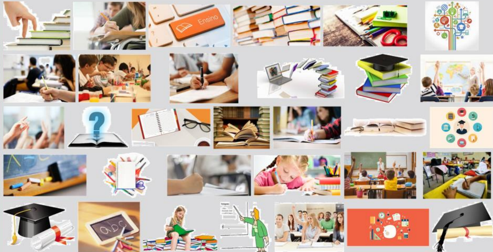
Figura 3 – Os 32 primeiros resultados da busca “ensino” – google.pt (10.out.2017) (Santos, 2018)