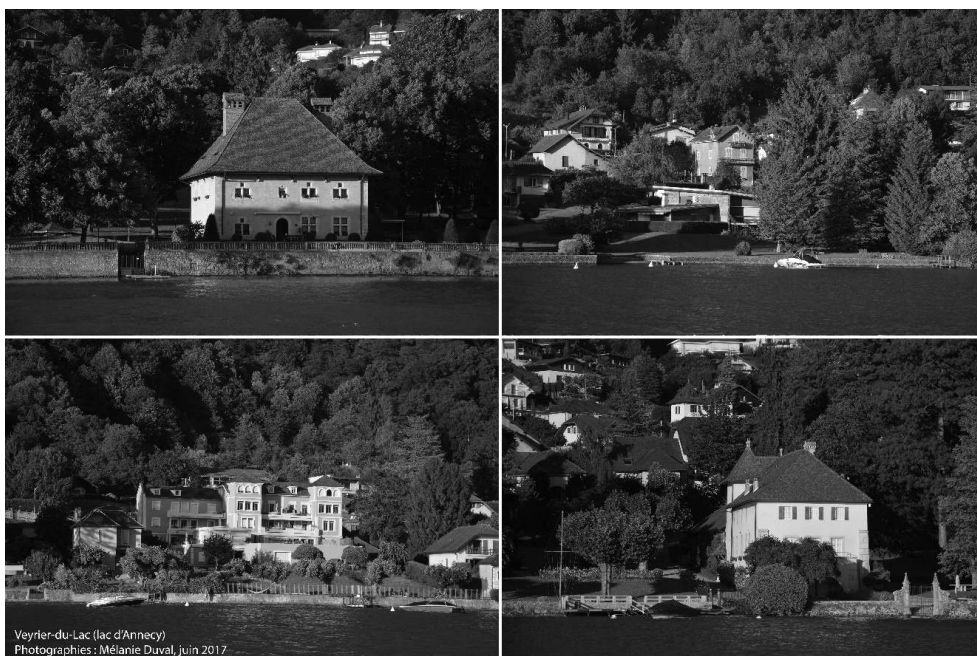
Planche photographique 4. Quand les croisières lacustres donnent à admirer les usages privés des rives

Ces photographies ont été prises un samedi de juin 2017 lors d'une excursion en « bateau privé » proposée par un prestataire touristique local. Elles illustrent la première partie de la visite du lac, intitulée « Sur les rives du lac » sur le site web du prestataire, qui donne à admirer les propriétés riveraines du lac de la commune de Veyrier, dont le littoral est occupé à 80% par des villas « pieds dans l'eau ».