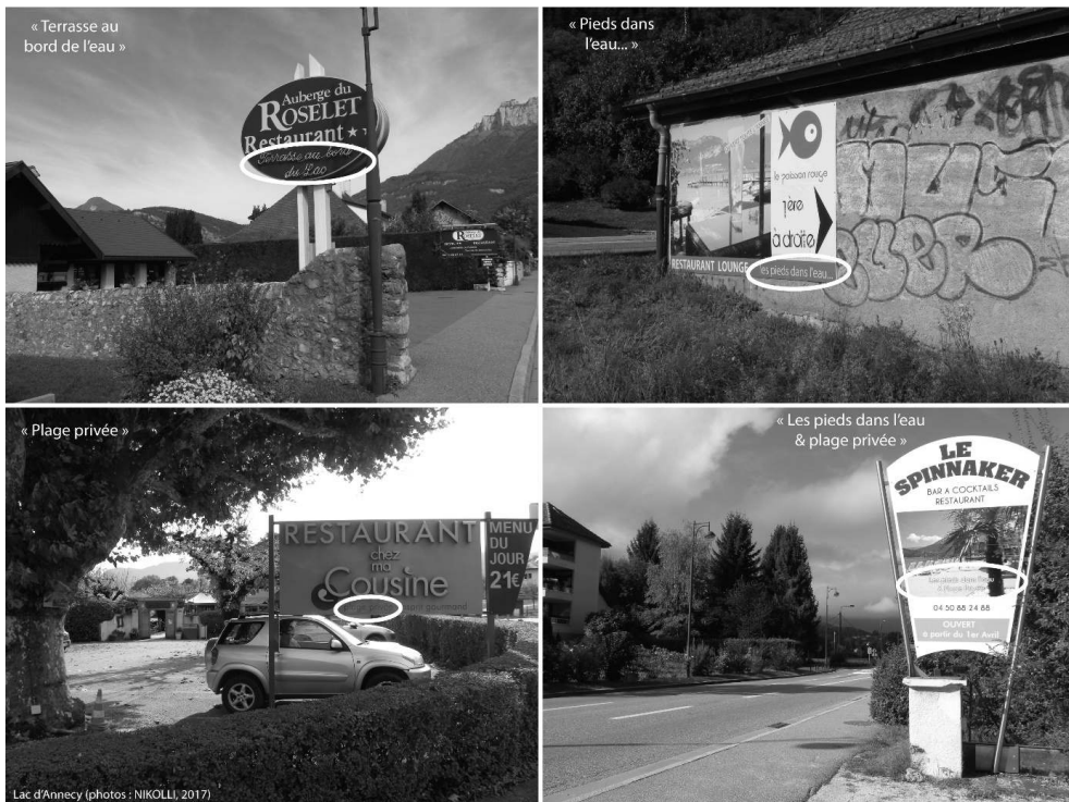
Planche photographique 3. La mise en valeur visuelle de l'accès exclusif au lac dans la communication web