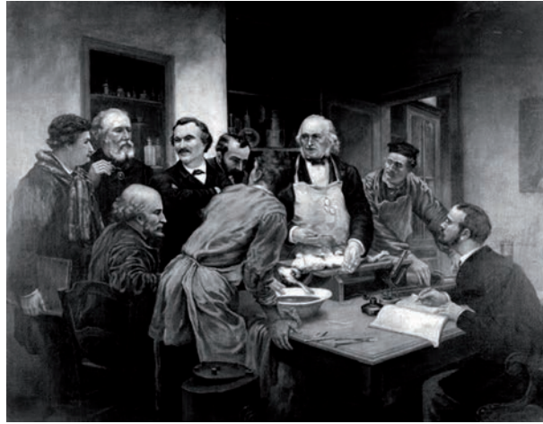
Figure 1. Claude Bernard expérimentant dans le caveau au Collège de France.