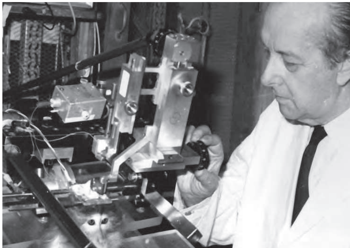
Alfred Fessard expérimentant sur le singe avec des microélectrodes électrophysiologiques.

Une première conception de la maladie est la maladie d'origine externe dont la cause est un agent étranger, comme un parasite, et qui aboutit, au XIX e siècle, à l'étiologie infectieuse de pathologies humaines. Après les recherches de modèles animaux de maladies infectieuses 6 , les recherches sur les vaccins qui connaissent un développement