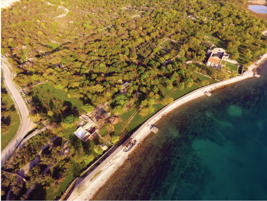
Sl. 2 Zračna snimka "crkvenog sklopa" na Mirinama (lokalitet Fulfinum – Mirine, Omišalj, otok Krk)

Slučaj ranokršćanske crkve na Mirinama u Omišlju na otoku Krku posebno je složen. Crkva se smješta na skutovima rimskog municipija Fulfina osnovanog u 1. st. po. Kr., najkasnije sredinom 5. st., u trenutku u kojem grad, iako još uvijek naseljen, opada, da bi bio u potpunosti napušten tijekom 7. stoljeća (Sl. 2). 20