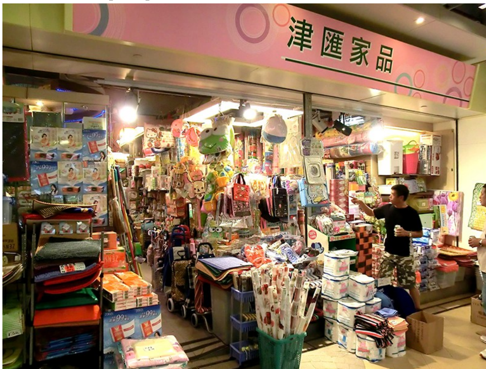
Figure 2. Une boutique du « Lok Fu Bazaar », partie de la galerie commerciale dissimulée derrière l'arcade principale

Dans l'arcade principale, seuls trois anciens marchands sont parvenus à rester sur place en faisant valoir l'originalité de leurs produits (verrerie d'art, spécialités de thé, pelotes de laine). Alors que leur loyer a plus que triplé depuis la rénovation, ils doivent négocier durement leur maintien dans les lieux à chaque renouvellement de bail. Une vingtaine de vendeurs d'articles plus ordinaires ont également été autorisés à rester sur le site, mais ils sont relégués à l'arrière du centre commercial, dans un emplacement peu fréquenté à l'appellation symptomatique de « Lok Fu Bazaar » (figure 2).