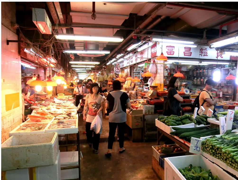
Figure 3. Wetmarket avant rénovation

REIT. Ce fut peine perdue, car les médias relayèrent à peine l'information et la cotation du Link ne fut nullement impactée.