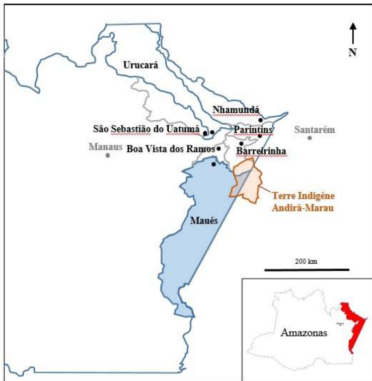
Figure 4. Territoire de la citoyenneté du Bas-Amazonas.

Le territoire de la citoyenneté du Bas-Amazonas. Il rassemble sept municipes, dont celui de Maués