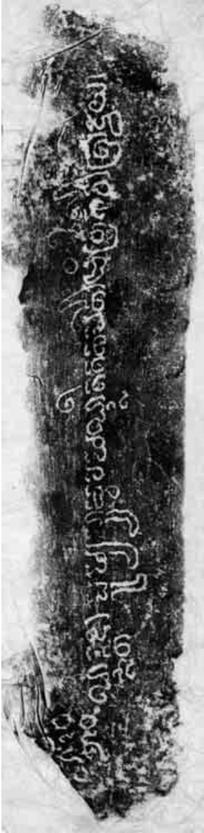
6. Bordure courte du socle. Estampage EFEO n. 1903.