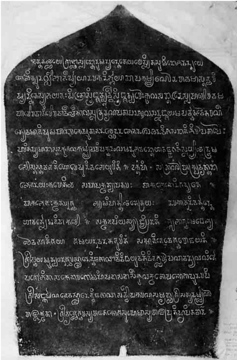
5. Face C de la stèle. Estampage EFEO n. 1902.