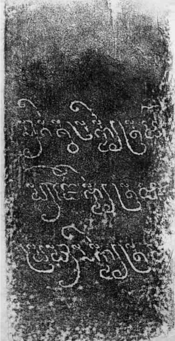
4. Face b de la stèle. Estampage EFEO n. 1901.