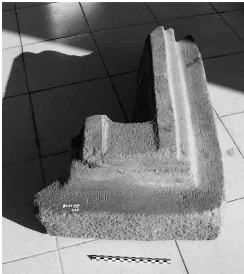
2. Socle.