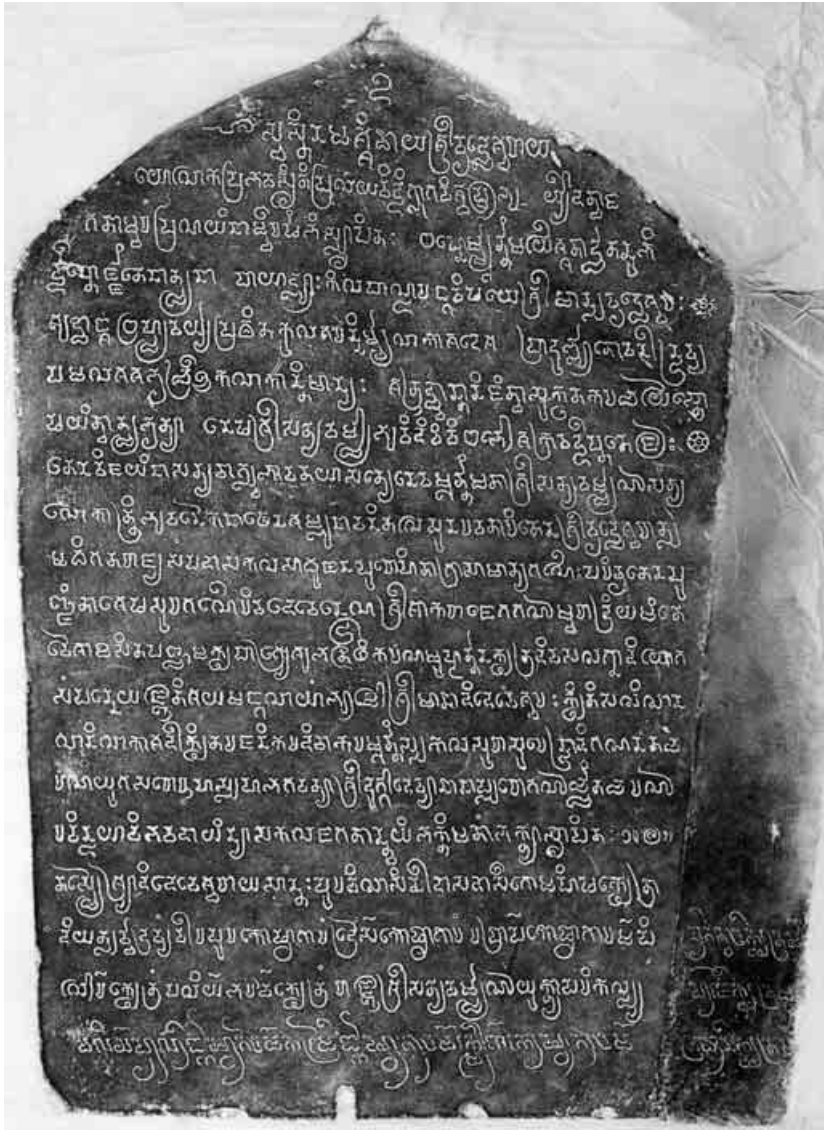
3. Face A (avec face b) de la stèle. Estampage EFEO n. 1900.