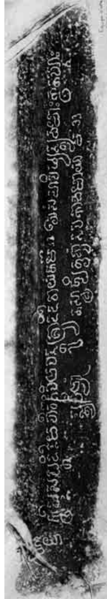
7. Bordure longue du socle. Estampage EFEO n. 1904.