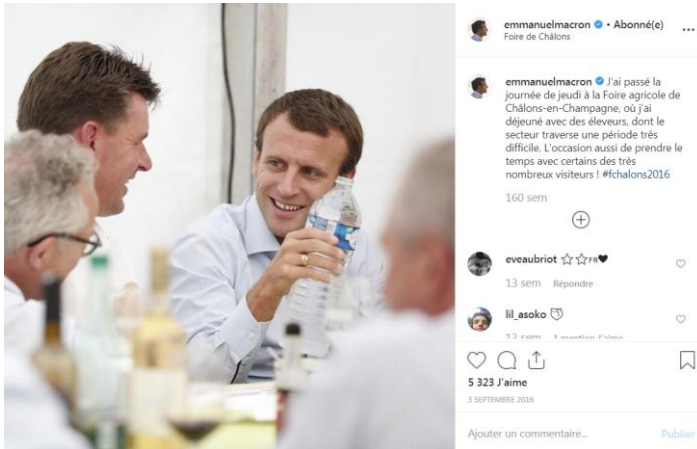
Fig. 3. Première publication sur le compte d'Emmanuel Macron.

La publication est explicitement attribuée au compte @emmanuelmacron (qui a été vérifié par la plateforme du RSN, ce qui permet d'attester la source énonciative du post). L'horodatage de la publication (le 3 septembre 2016) et la localisation géographique (la Foire de Châlons) ancrent cet acte énonciatif dans un cadre spatio-temporel. L'énonciation contient deux phrases suivies du hashtag #fchalons2016, permettant de mettre en relation thématique cette publication avec toutes celles ayant trait à cette foire agricole. Les interactions les plus récentes sont présentées en dessous de l'énonciation d'Emmanuel Macron ainsi que le nombre de contributeurs ayant aimé cette publication. Les « technosignes » 6 (ou technoboutons) ainsi que la zone de saisie d'un commentaire constituent autant d'appels à l'interaction des contributeurs.