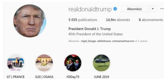
Fig. 2. Profil du compte de Donald Trump.

Le compte @emmanuelmacron compte 433 publications au 28 septembre 2019 alors que le compte @realdonaldtrump en compte 5030. Par ailleurs, le compte du président de la République française ne contient pas de stories à la une contrairement à celui de Donald Trump.