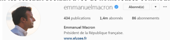
Fig. 1. Profil du compte d'Emmanuel Macron.

La paucité des contributions sur le compte Instagram d'Emmanuel Macron met en relief la rareté de la parole présidentielle sur ce RSN. Il est intéressant de comparer les stratégies discursives très différentes adoptées par le président français et le président américain, qui utilise abondamment les réseaux sociaux avec de nombreuses contributions quotidiennes :