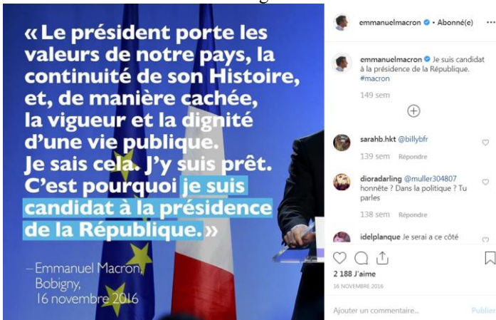
Fig. 4. Déclaration de candidature d'Emmanuel Macron.

La publication ci-dessous illustre un tel usage :