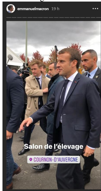
Fig. 8. Story d'Emmanuel Macron : vidéo au Sommet de l'élevage.

La visite d'Emmanuel Macron le 4 octobre 2019 au Sommet de l'élevage (salon européen des professionnels de l'élevage) à Cournon-d'Auvergne a donné lieu à 18 courtes vidéos. La première story (la plus ancienne chronologiquement) est illustrée par une capture d'écran montrant le président lors de son arrivée au salon, une image fixe sur laquelle sont indiqués le fragment textuel « Salon de l'élevage » à valeur de topique et le technomot/technolien « Cournon-d'Auvergne » assurant une fonction de géolocalisation :