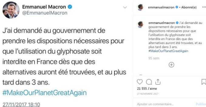
Fig. 6. Auto-citation transmédiat d'Emmanuel Macron.

L'auto-citation transmédiat/trans-RSN est aussi une stratégie souvent mise en œuvre par les acteurs politiques pour diffuser et faire circuler leurs « petites phrases » 9 et les partager avec d'autres contributeurs. Intéressons-nous à la genèse de cette publication :