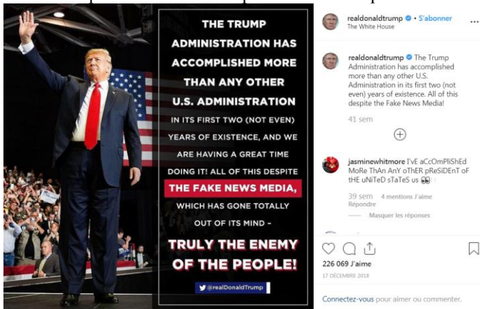
Fig. 7. Auto-citation transmédiatique de Donald Trump.

La publication d'Emmanuel Macron met en avant une opération relativement simple qui est une capture d'écran. La mise en forme de la publication peut être bien plus élaborée quand l'iconotexte 12 est considérablement retravaillé (emploi de différentes polices, d'italiques, et, éventuellement, changement de couleur ou mise en surbrillance de fragments textuels) comme dans la publication suivante postée sur le compte de Donald Trump :