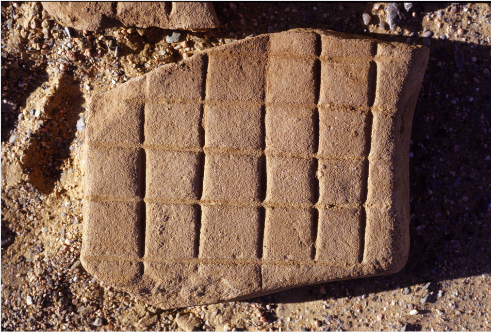
Figure 2 Ludus Latruncolorum aus Krokodilo (ver- öffentlicht bei Matelly 2003 p. 594 mit fig. 278; Foto: Adam Bülow-Jacobsen; mit freundlicher Erlaubnis von H el ene Cuvigny).

g ttlichen Wirkkraft einen kleinen oder gr o eren steinernen Altar zu stiften und damit sich so bedanken, wie man dies im Imperium Romanum gerne tat und wie dies von allen antiken Formen solcher Dankbarkeit heute noch am besten zu fassen ist.