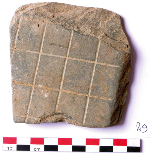
▲ Figure 3: Ludus Latrunculorum aus Xeron (Foto: Adam Bülow-Jacobsen; mit freundlicher Erlaubnis von H el ene Cuvigny).