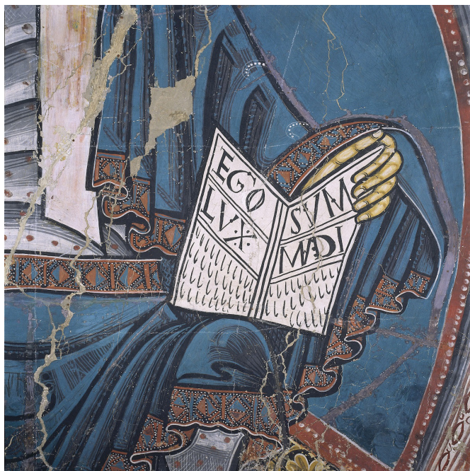
Fig. 9 : Barcelone, MNAC, peintures murales de l'église Saint-Clément de Taüll, abside centrale, livre tenu par le Christ en majesté.