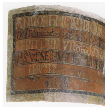
Fig. 10 : Barcelone, MNAC, peintures murales de l'église Saint-Clément de Taüll, nef, côté nord, inscription de consécration.