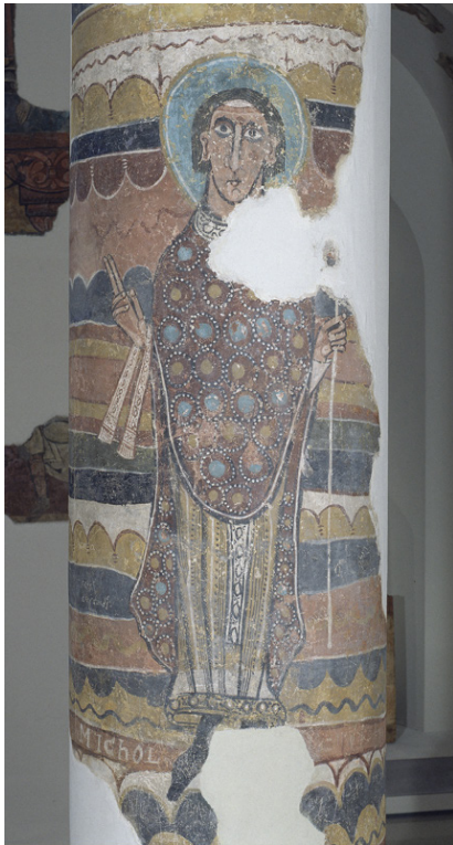
Fig. 6 : Barcelone, MNAC, peintures murales de l'église Sainte-Marie de Taüll, nef, côté sud, saint Michel.