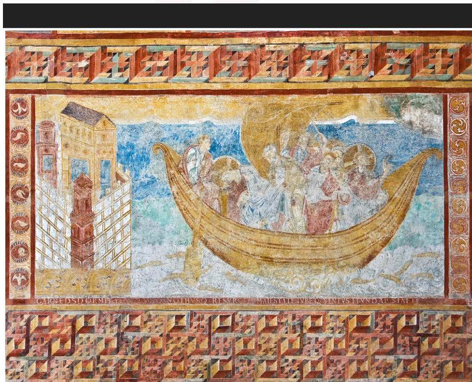
Fig. 3 : Reichenau-Oberzell, église Saint-Georges, peintures murales de la nef, Jésus calmant la tempête.