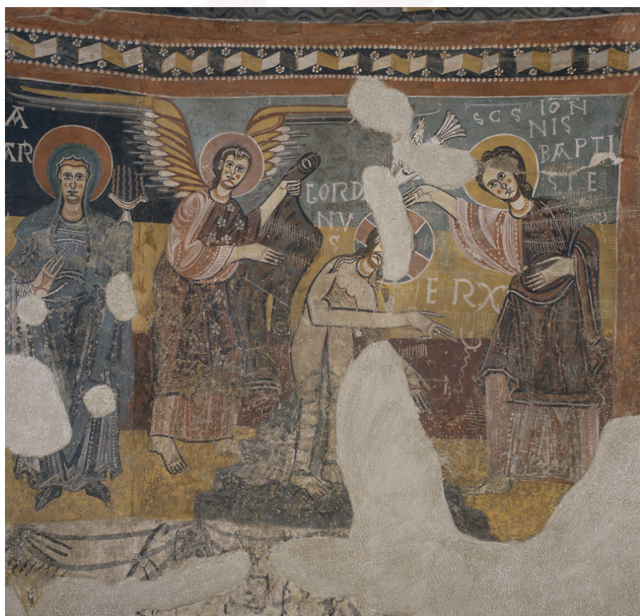
Fig. 11 : Barcelone, MNAC, peintures murales de l'église Sainte-Marie d'Estabon, mur circulaire de l'abside, scène du baptême du Christ.