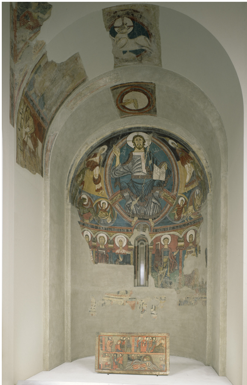
Fig.1: Barcelone, MNAC, peintures murales de l'église Saint-Clément de Taüll.