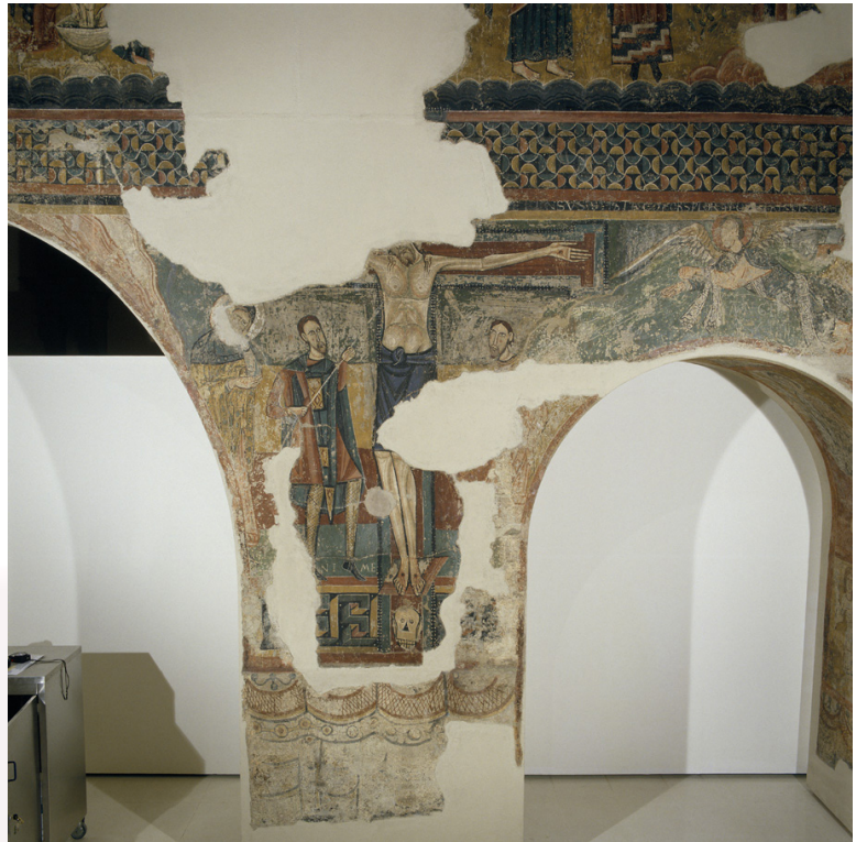
Fig. 7 : Barcelone, MNAC, peintures murales de l'église Saint-Pierre de Sorpe, mur nord, Crucifixion.