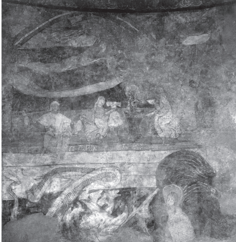
Fig. 2 : Saint-Pierre-les-Églises, abside, Nativité.