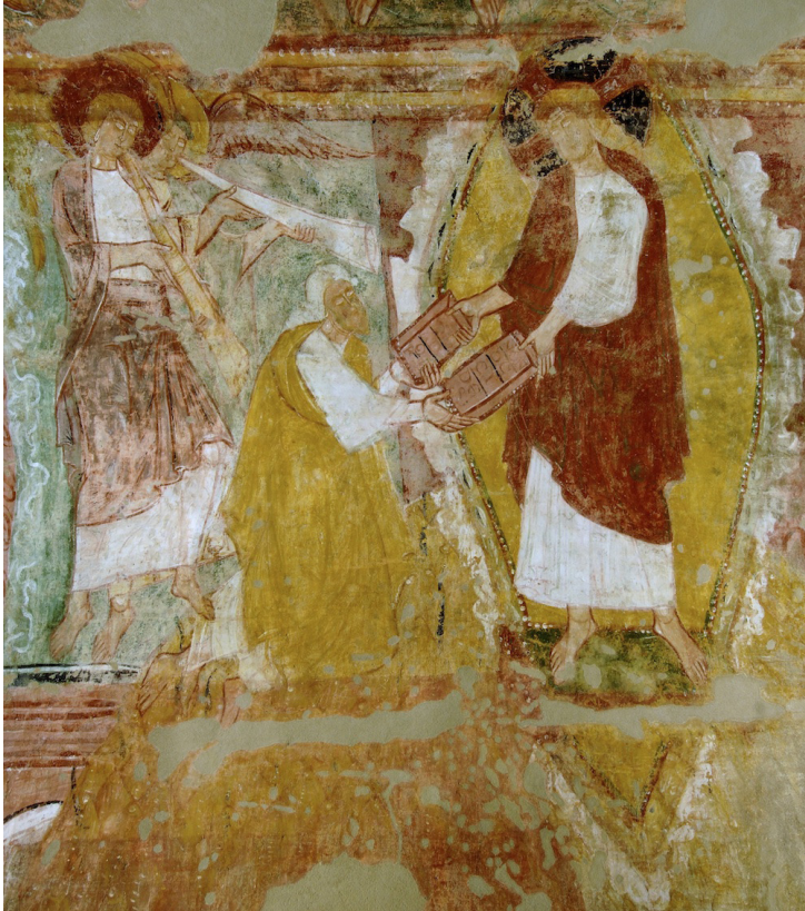
Fig. 4 : Saint-Savin-sur-Gartempe, abbatale, nef côté, côté nord, Moïse recevant les tables de la Loi.