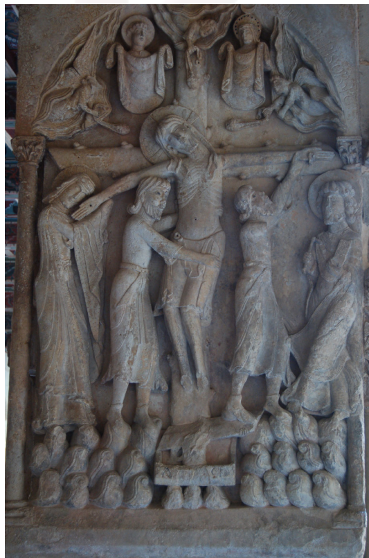
Fig. 8 : Santo Domingo de Silos, abbaye, cloître, relief de la Descente de croix.