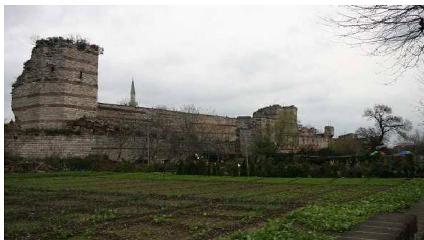
Fig. 2 : Les tours 36 et 37 (premier plan). Porte de Silivri au fond.