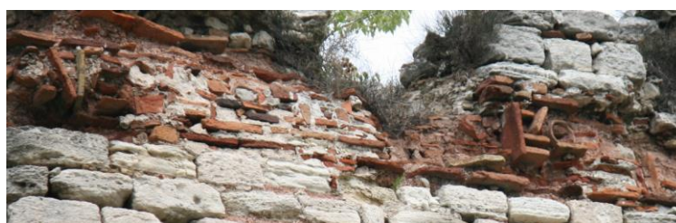
Fig. 12-2 : Inscription de la tour 63

-- -]Ε . / [ . 3 . ] VONOE . . Χ . KAI | ΘΕΥ_Ο [ . . . 9 . . . ] . Ο [ . . . ] . . .]καὶ Θεοδο[ . . . ]