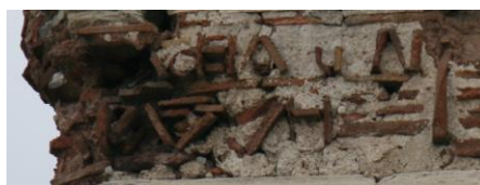
Fig. 4 : Inscription de la tour 18

Ἰησοῦς Χριστὸς νικᾷ. Λέ[ο]ντος [κ]αὶ Κων[σ]ταντίνου [με]γάλ[ον βασιλέ]ον καὶ αὐτοκ[ρ]ατώρον, πολλ[ὰ τὰ ἔτη.]