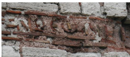
Fig. 10 : Inscription de la tour 56

+ Λέων καὶ Κ[ωνσταντῖνος] . . . ἐ]ν θεῷ νικ[ηφόροι] ? (Tour de) Léon et Constantin...Dieu, vainqueurs... ?