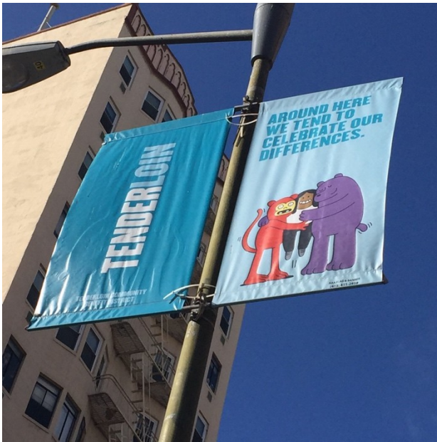
1. Une affiche célébrant la diversité du quartier de Tenderloin