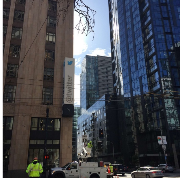
2. Le siège de Twitter à San Francisco (C. Ruggeri, 2018)

Autour de la gentrification et au-delà de ce processus central pour comprendre les dynamiques urbaines san-franciscaines, l'ouvrage de Sonia Lehman-Frisch se construit autour d'un fil rouge : la question de l'identité urbaine de la métropole californienne. San Francisco est en effet associée à de nombreux clichés et images : les cable-cars , les collines, les maisons victoriennes, le berceau de mouvements et communautés alternatives, sa tolérance, son progressisme politique... L'idée de l'ouvrage n'est pas de démontrer que tout est faux, puisque l'auteure rappelle que le drapeau Arc-en-ciel a été créé dans la ville à la fin des années 1970 par des militant·e·s LGBT, mais aussi que, plus récemment, les habitant·e·s de San Francisco ont voté à 84 % pour Hillary Clinton lors des élections de 2016. Sonia Lehman-Frisch insiste toutefois sur le fait que les trajectoires socio-économiques de la ville donnent aujourd'hui à voir la construction d'une « identité dans la contradiction » et qui plus est d'une « identité multiscalaire », San Francisco ne pouvant se penser sans la baie qui l'entoure.