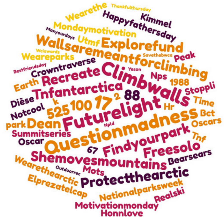
Nuage de mots

- Les tweets ayant été le plus retweetés avaient majoritairement pour thème : @alexhonnold's (Free Solo - Ascension EL Capitain), Escalade, les origines de la marque Athlètes sponsorisés par la marque (David Lama, Jess Roskelley, Hansjörg Auer), Ecologie (accord de Paris), etc.