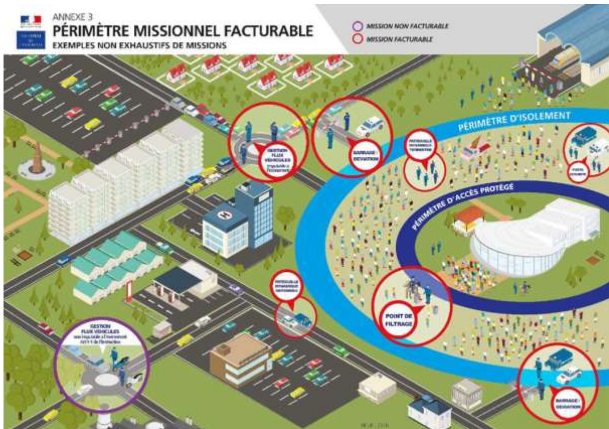
Figure 1. Schéma du « périmètre missionnel »

Ce périmètre donne lieu à des interprétations juridiques variables (Lavaine, 2018) et ouvre ainsi des « passes » dans le droit (Lascoumes et Le Bourhis, 1996), en offrant une marge de manœuvre conséquente dans la qualification des situations. Un préfet interrogé affirme à