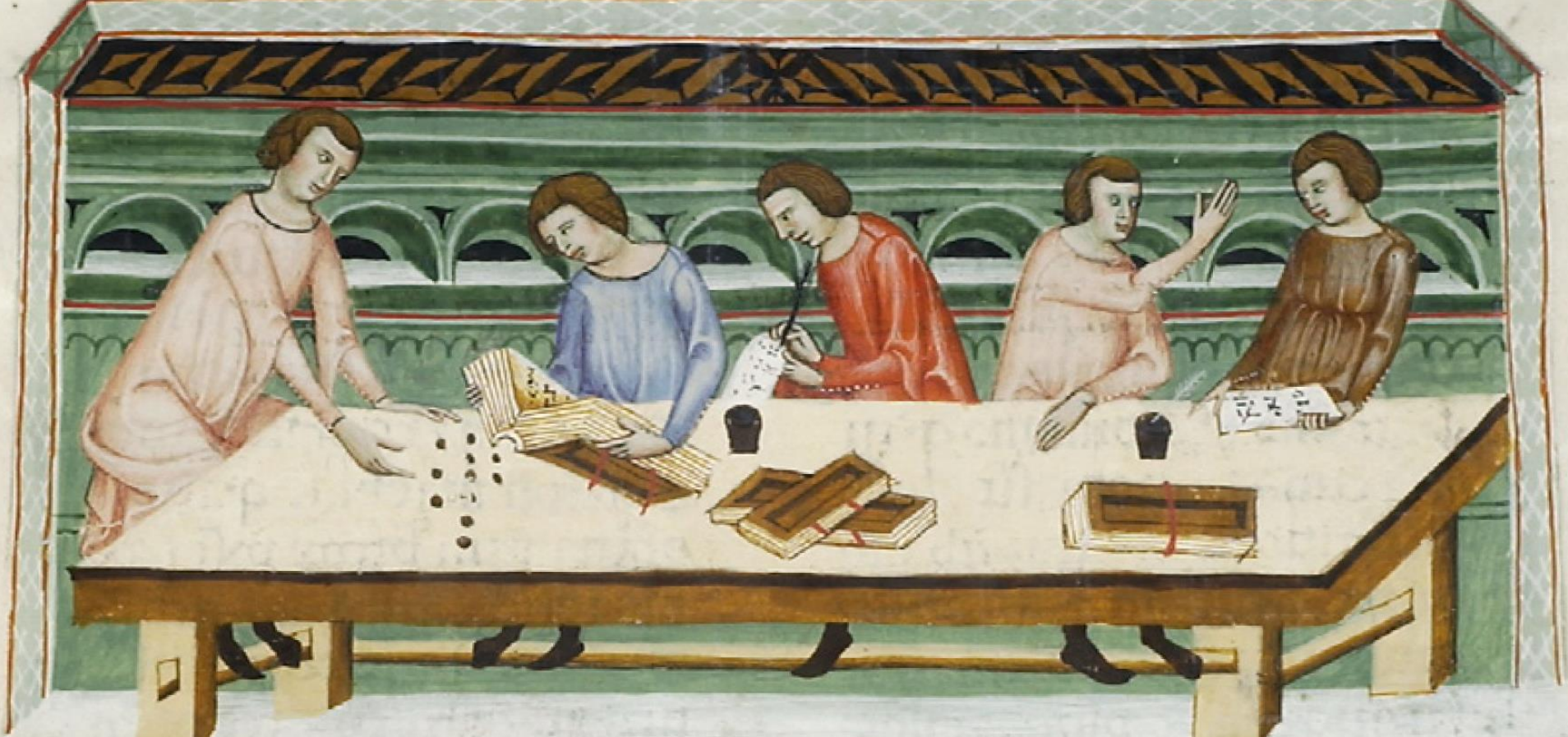
Vérification de comptes par le Maestre Racional. (Leges Palatinae, Bibliothèque royale de Belgique à Bruxelles, Ms.9169, 46 verso)

Des registres de comptabilité renseignent sur chaque élément du patrimoine royal, ainsi que les revenus et les dépenses qu'il occasionne.