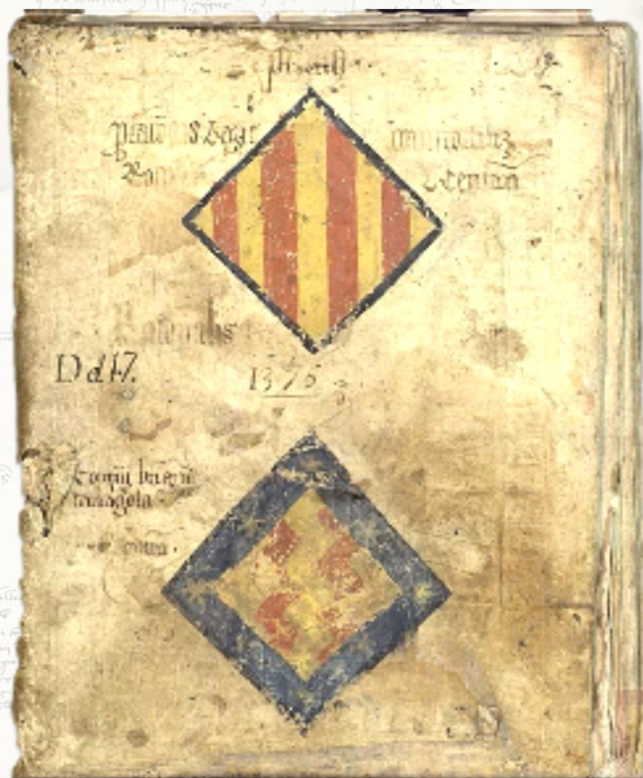
Cette couverture des comptes de 1376 de Berenguer de Magarola, procureur royal de Roussillon et de Cerdagne, est conservée aux Archives de la Couronne d'Aragon (Barcelone). Le blason de la Procuration royale reprend les couleurs de l'écu royal et surmonte la représentation des armes de la famille barcelonaise des Magarola. (Archives de la Couronne d'Aragon, Real Patrimonio, Maestre Racional, volume 26)

En 1344, le roi Pierre IV d'Aragon conquiert les comtés de Roussillon et de Cerdagne et proclame l'union perpétuelle de ces territoires avec les Etats de la Couronne d'Aragon (Catalogne, Baléares, Valence, Aragon).