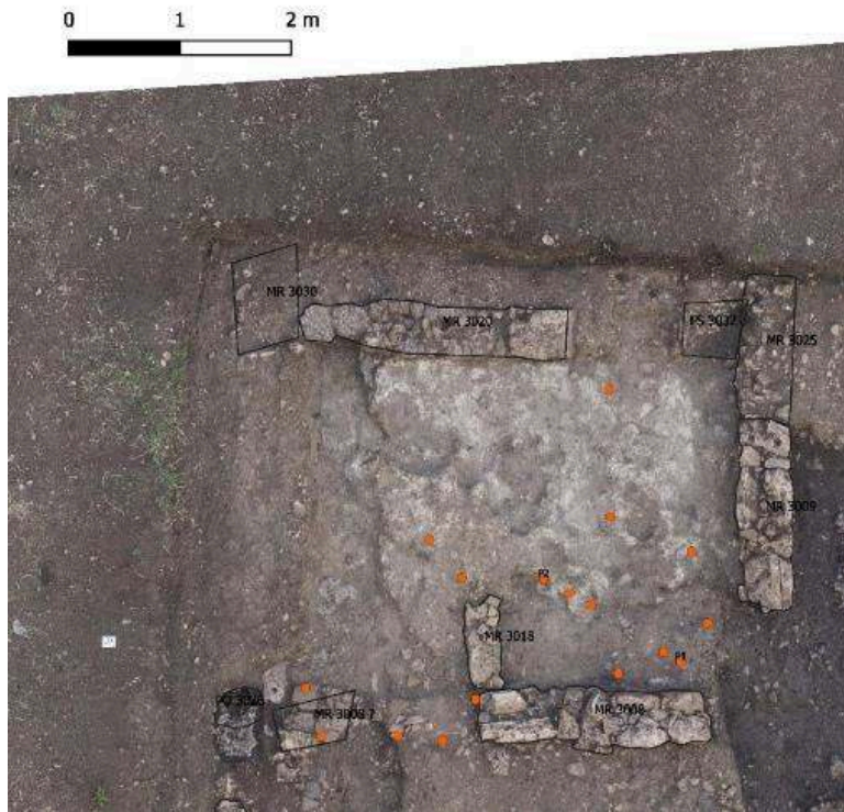
Fig. 4 – Localisation des pesons et bobines dans la pièce Est du lot 114E4.