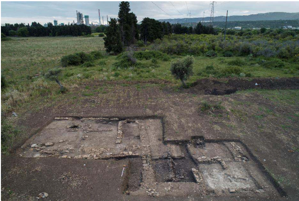
Fig. 1 – Le sondage A de la fouille 2019 vu du Nord.