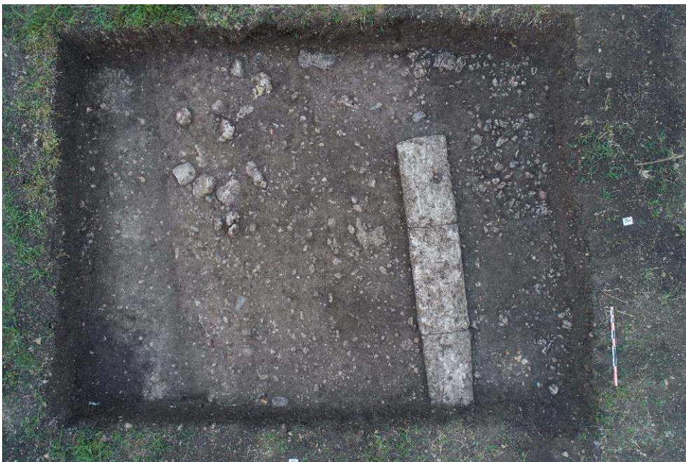
Fig. 6 – Sondage B, vue zénithale. On identifie le tracé de la rue E12 et le mur en grand appareil.