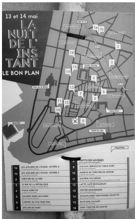
Figure 3 – Photographie d'une affiche de l'édition 2016 de La Nuit de l'Instant dans une rue du Panier