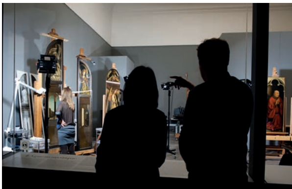
2. Travaux de restauration de L'Adoration de l'agneau mystique des frères Van Eyck au Museum Schone Kunsten à Gand en 2012.

Il ne faut pas oublier que, dans certains arts, les spectateurs sont aussi parfois des usagers et les questions se déclinent alors différemment. André Leroi-Gourhan faisait remarquer en 1950 qu'on ne pouvait étudier les sièges sans examiner les manières de s'asseoir 22 . C'est bien connu, les utilisateurs contribuent à la mise au point et à l'adaptation des produits. Comme David Edgerton l'a brillamment montré dans ses « Dix thèses éclectiques sur l'histoire des techniques » publiées en 1998, passer de l'étude des inventeurs et des inventions à celle des usagers et des usages change la manière d'écrire l'histoire des techniques 23 . Il ne s'agit plus de repérer quand apparaissent de