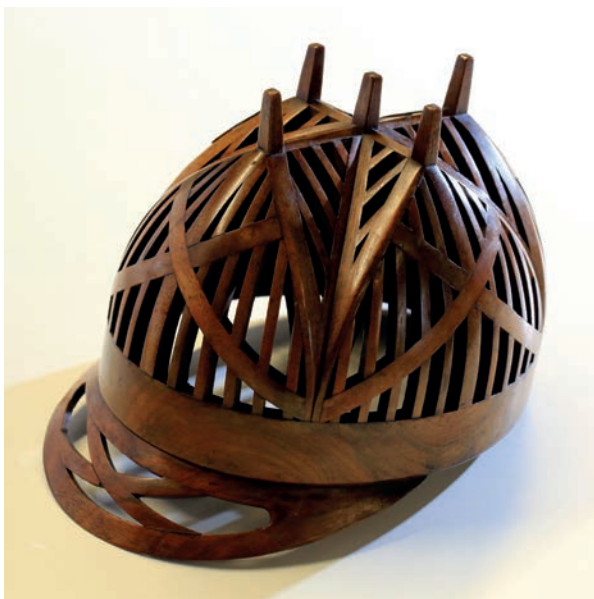
4. Casquette d'un compagnon du Devoir charpentier, Angers, Centre de la mémoire des compagnons du Devoir.

tels John Ruskin, Alois Riegl ou Gottfried Semper, et montre comment cette histoire anonyme permet de présenter les productions artisanales comme des émanations directes d'un art national et « populaire ».