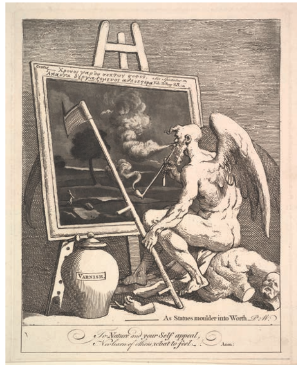
5. William Hogarth, Time Smoking a Picture , vers 1761. Cette gravure satirique est une charge contre l'idée selon laquelle le temps valorise l'art.