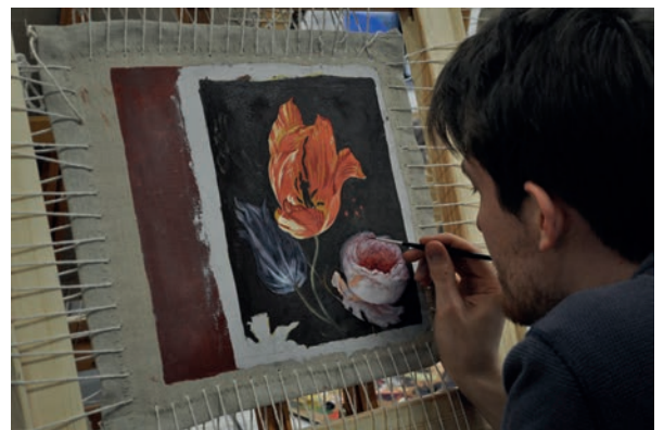
6. Cet étudiant du Master Technical Art History de University of Glasgow est en train de copier un détail d'une nature morte hollandaise du XVII e siècle d'Abraham Mignon, en s'appuyant sur les consignes d'un traité sur les techniques picturales de Willem Beurs, De groote waereld in 't kleen geschildert (Zwolle, 1692).