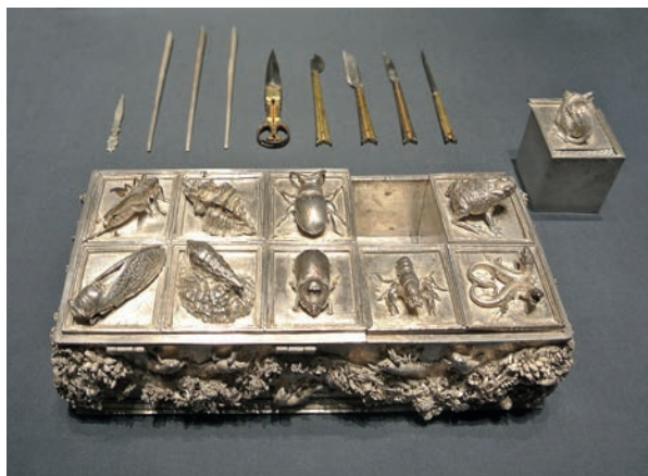
7. Boîte en argent pour matériel d'écriture réalisée par l'orfèvre Wenzel Jamnitzer vers 1560-1570, Vienne, Kunsthistorisches Museum.

limitées qui compliquent l'identification des matériaux et des techniques, ces reconstitutions sont essentielles pour enrichir notre point de vue contemporain sur les savoir-faire artisanaux 34 . À cet égard, la reconstitution des recettes pour le moulage sur modèle vivant tel que le pratiquaient des orfèvres comme Wenzel Jamnitzer (fig. 7), et qui sont décrites dans un traité français du XVI e siècle réunissant un large éventail de méthodes artisanales, est exemplaire : l'analyse du texte associée aux connaissances d'un restaurateur en métal expérimenté et d'un historien des sciences a débouché sur des reconstitutions pertinentes, qui ont livré un ensemble significatif de renseignements aux historiens de l'art, ainsi qu'aux restaurateurs et aux historiens des sciences 35 .