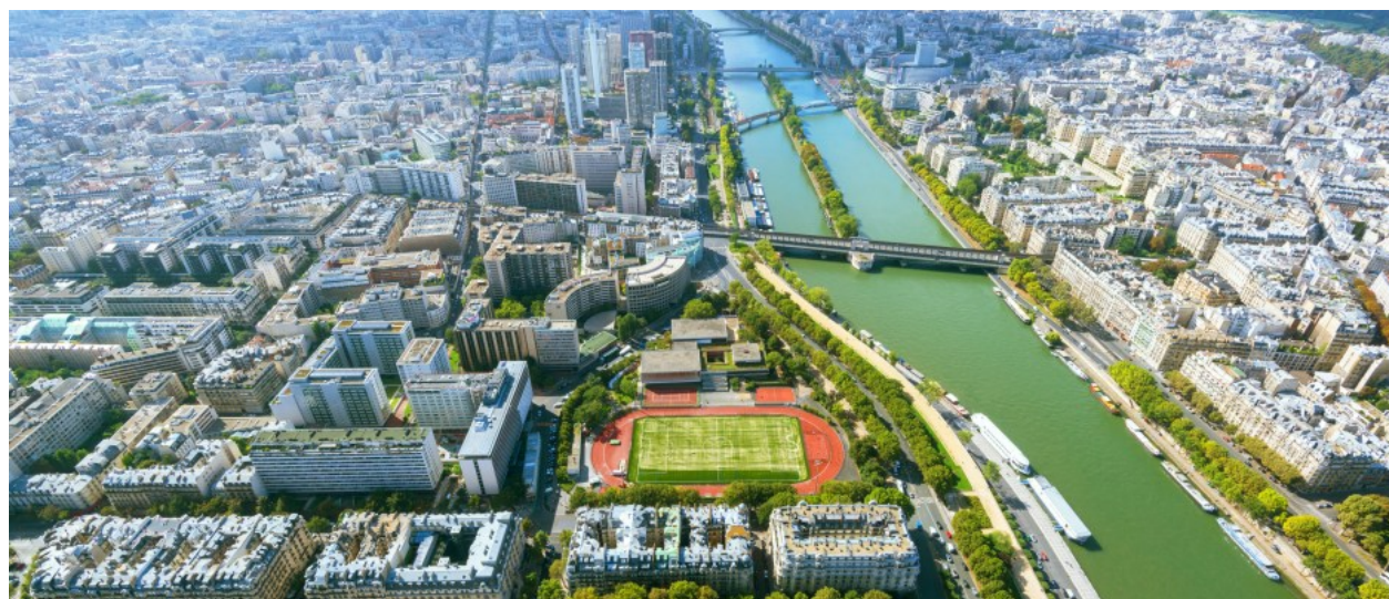
View of Paris from the Eiffel Tower

Posted on 21 avril 2020 by societageo in Les géographes lisent le monde // 0 Comments