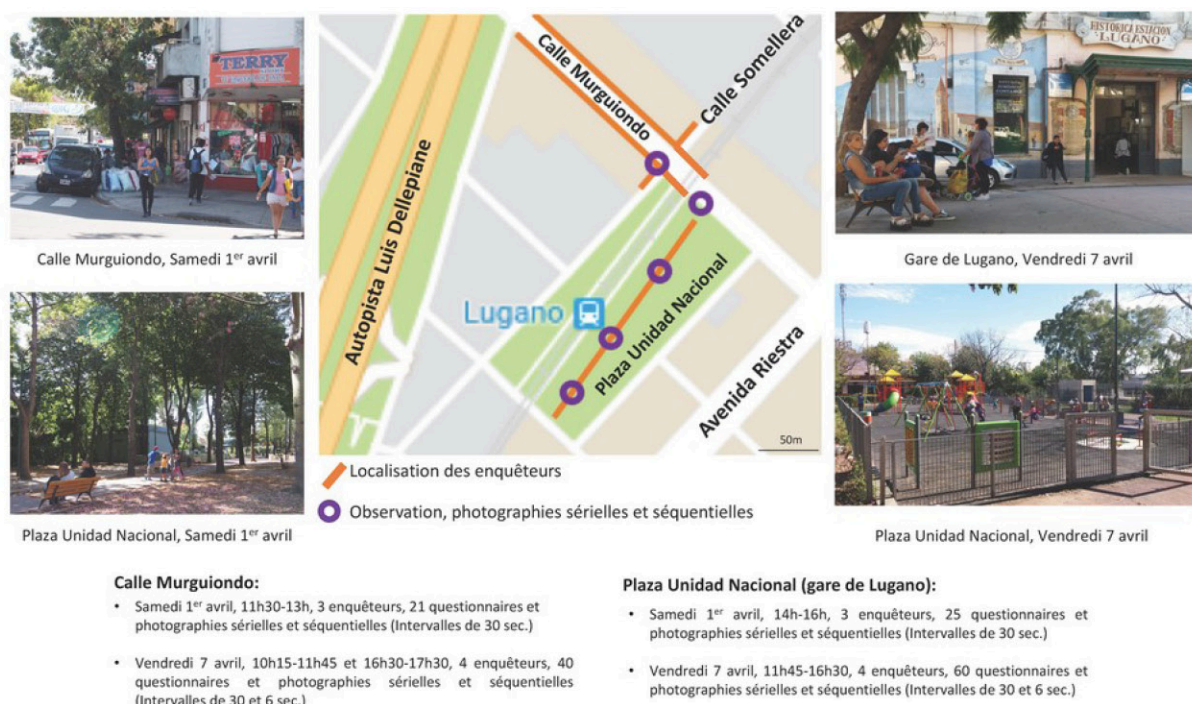
Figure 3 : Plan de localisation et photographies de la gare de Lugano (Buenos Aires)

L'enquête auprès des passants 41 et l'observation concomitante des mobilités et de l'activité commerciale des vendeurs ont ouvert un premier niveau de questionnements sur la problématique de la densité et de l'intensité des flux. Si notre premier terrain, réalisé le samedi matin au point d'observation 1 (figure 3), a conduit à conclure à une présence majoritairement féminine, le choix d'y répéter une seconde série d'enquêtes et de mettre en place des prises vidéo et des séquences photographiques à cadence courte (toutes les six secondes) à différents moments de la journée a permis de vérifier et de dépasser ce premier niveau de lecture.