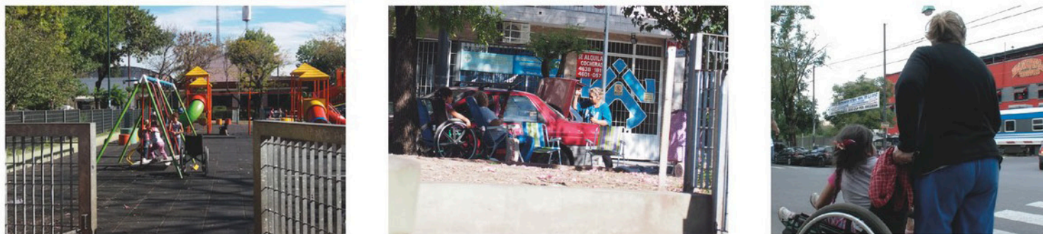
Figure 5 : Usages des lieux et intrication des statuts au quotidien (gare de Lugano, Buenos Aires)

En fin de journée, la poursuite de nos observations dans la zone où nous avons observé le marchand de bijoux nous a permis de retrouver la présence de la femme en charge de l'enfant handicapée (cf. photographie en bas à droite).