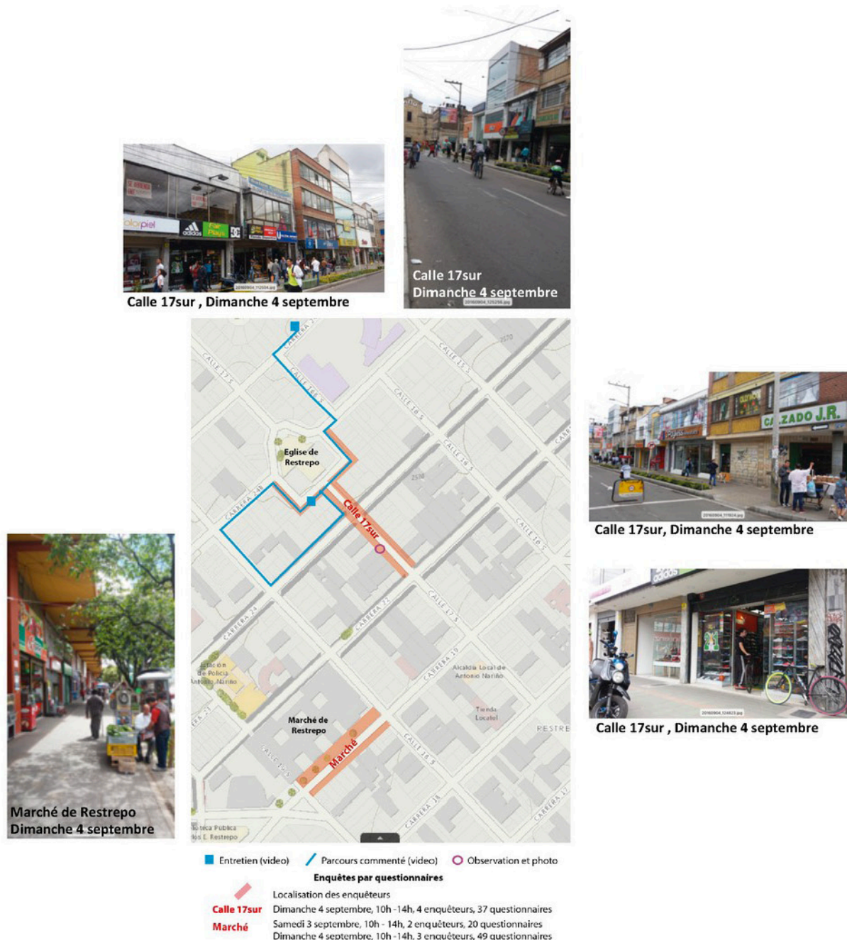
Figure 2 : Plan de localisation et photographies de la Calle 17 sur (Bogota)

Forts de ce positionnement méthodologique, nous avons choisi de le déployer dans le cadre d'une rue commerçante de Restrepo, la Calle 17 sur, qui concentre un nombre important de lieux de production et de commercialisation d'articles en cuir (figure 2). Nous avons réalisé l'enquête durant la matinée du dimanche, ce qui correspond au jour de fin de semaine qui nous avait été signalé comme un temps fort de l'activité commerciale. En parallèle du travail opéré au sein de la Calle 17 sur et pour prévenir un effet de lieu et d'horaire, nous avons placé un autre groupe d'enquêteurs devant le marché de Restrepo situé à proximité.