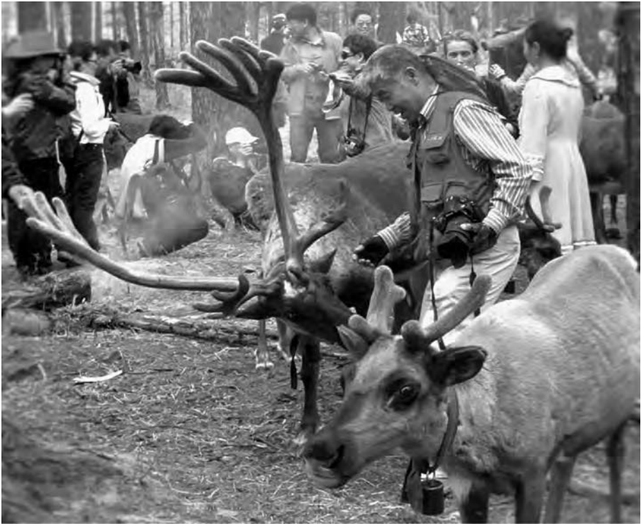
Figure 2 – Touristes sur un campement