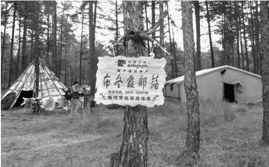
Figure 1 – Habitats nomades – campement dans la région de Genhe

Dans le village d'Aoluguya, les autorités ont créé un patrimoine culturel du renne décliné dans divers lieux. Comment ce patrimoine est-il mis en valeur sur les campements nomades afin de répondre aux attentes des touristes ? Si les activités et les lieux proposés sont moins diversifiés que dans le village, sur leurs campements, les Évenk possèdent en revanche deux éléments phares de la « culture du renne » : leurs troupeaux de rennes et l'habitat nomade.