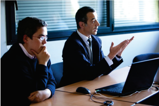
Intervention d'un chef d'établissement

D'autre part, l'intervention a induit une forte augmentation de l'apprentissage et une baisse du décrochage : la proportion de décrocheurs en fin de troisième est ainsi diminuée de 40% (elle passe de 8,8% à 5,1%). Toutes ces différences sont statistiquement très significatives, c'est-à-dire qu'elles ne sont pas le fruit d'aléas dans les échantillons enquêtés, mais reflètent des différences réelles entre les deux populations comparées.