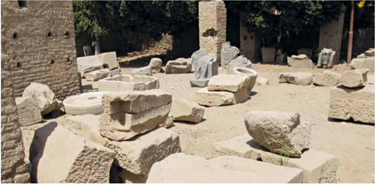
Fig. 158. Secteur des anciens magasins, prévu pour le futur musée en plein air.